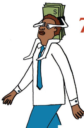
7 Guwernmanḡ as sataafirik sos diikayinen wankúlulumak kuréneim man kukaan kuwañaak man kukat man kunenem eluukiitay noo yooliil