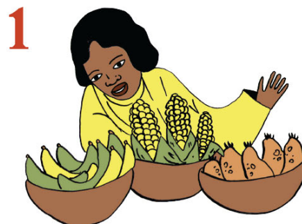
1 Eluukiitay yati kuwañaak ekuumenem afirik