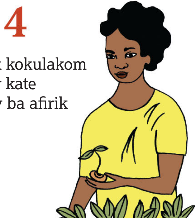
4 Kuseekak kokulakom kunenaay kate eluukiitay ba afirik