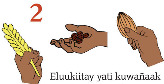
2 Eluukiitay yati kuwañaak ejajak, eabaj dibanoosan