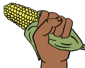
5 Man kuwañaak kucookoorem eluukiitay ejonenejoone eabaj difuwañafreoor di pooy muriiyam