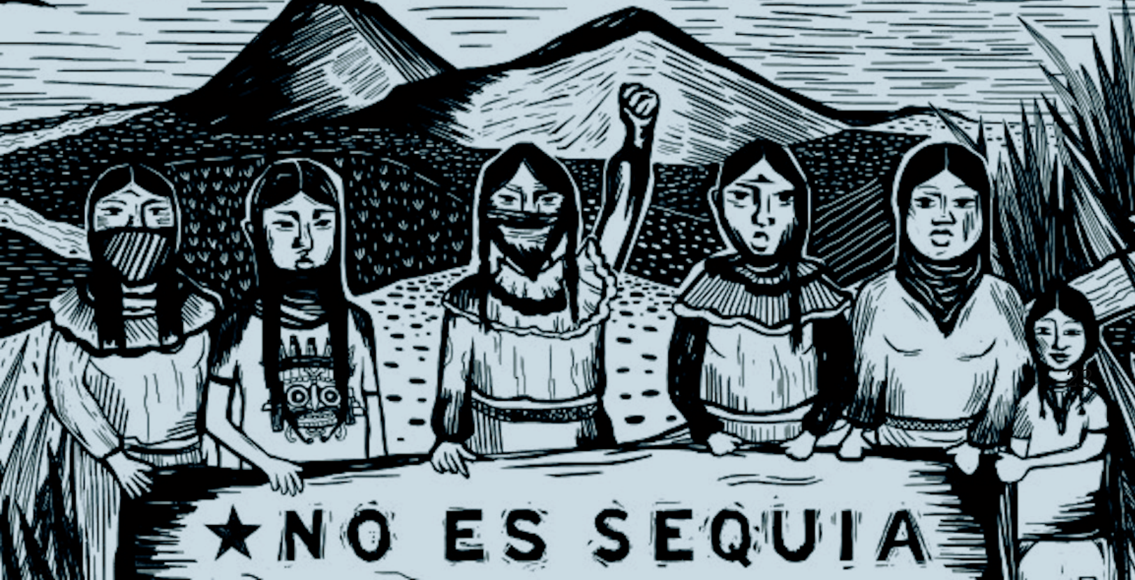
Ilustraciones de Giovanna Joo aparecidas en Tramas, un proyecto de investigación-acción de la Coalición Feminista Decolonial de Justicia Digital y Ambiental