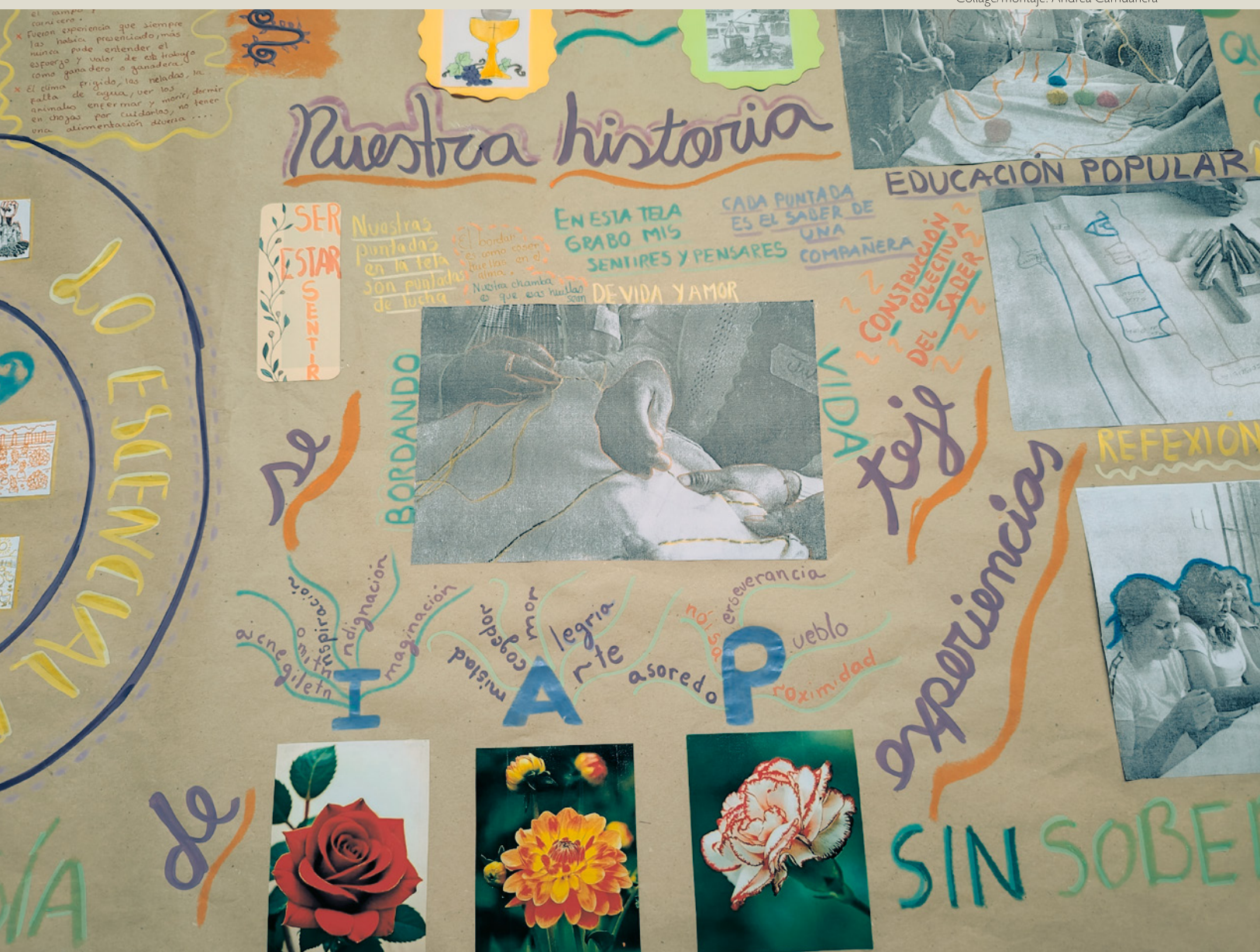
Collage/montaje: Andrea Carhuarica

Desde la agroecología una de las principales consignas es la de que la tierra es para quien la trabaja. Sin duda resolver el problema de la distribución desigual de la tierra abre un camino de posibilidades para dignificar la vida de las comunidades campesinas