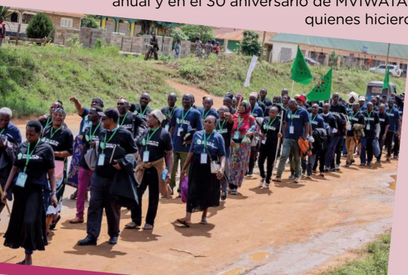
Marcha de MVIWATA hacia la conferencia en Mjombe, Tanzania, por Fiola Serubia / Pan Africanism Today.