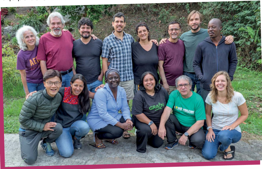
Reunión anual del equipo de GRAIN en Santandercito, Colombia.