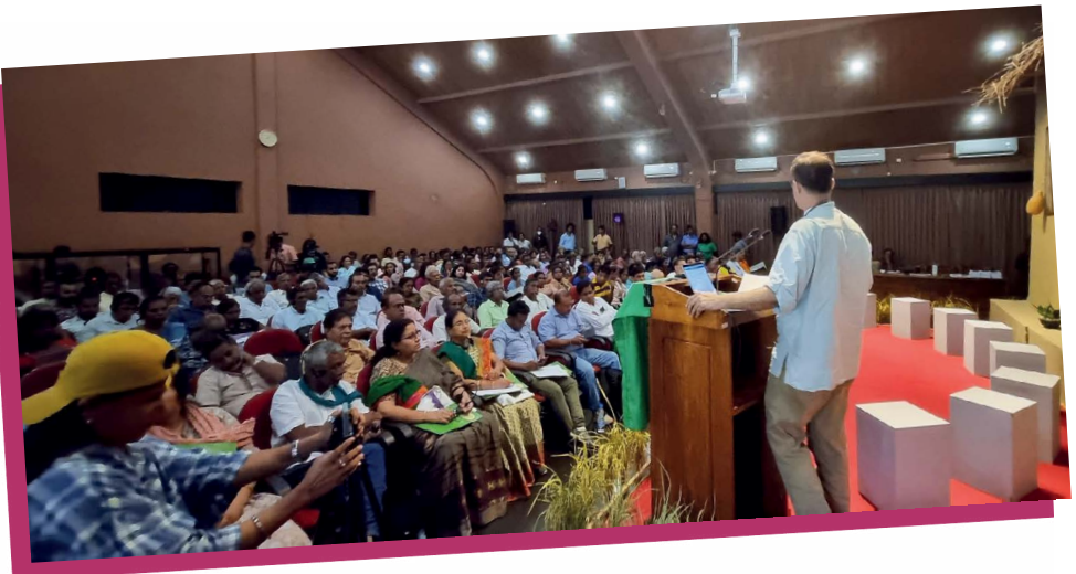
Un integrante de GRAIN durante una presentación en el foro agroecológico nacional de MONLAR, Sri Lanka.