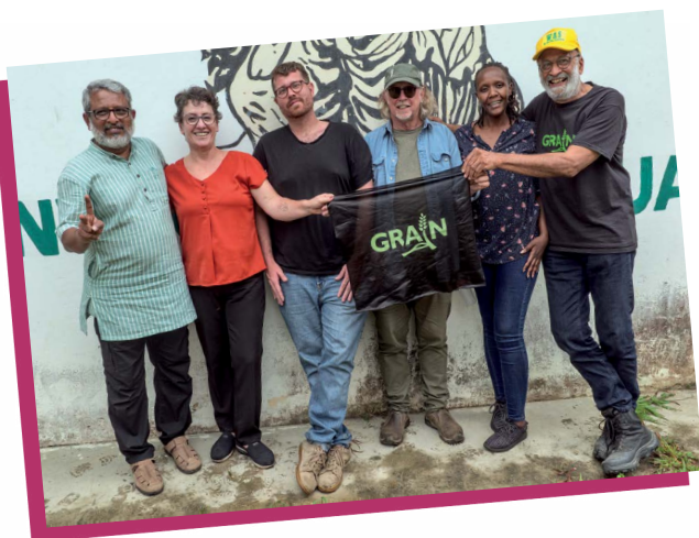
Miembros de la Junta Directiva de GRAIN en el Instituto Agroecológico Latinoamericano María Cano en Colombia.