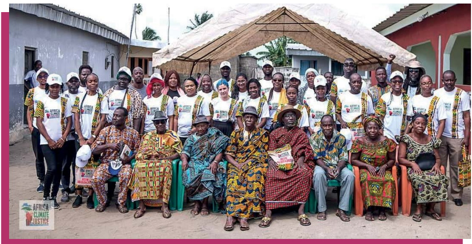
Visita de campo de integrantes de ACJC en Taboth, Costa de Marfil por ACJC /Wale.