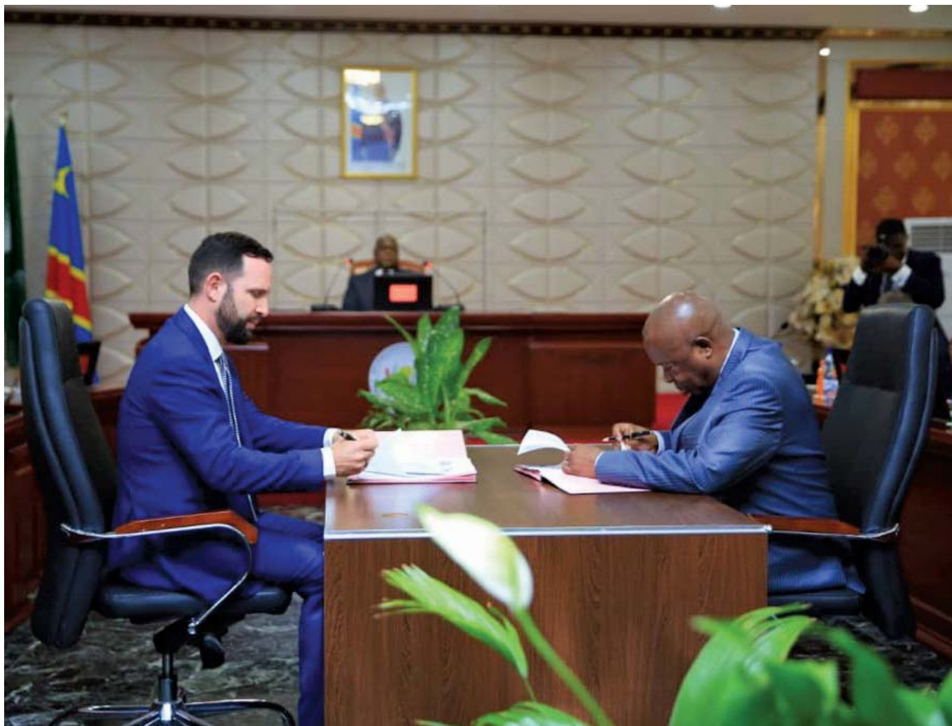
O Ministro da Agricultura da RDC e um representante da Vital Capital assinaram em 2019 um memorando de entendimento para iniciar cinco zonas agro-industriais em todo o país, com um custo de 150 milhões de dólares.

Diz-se que muitos dos projectos se baseiam no modelo moshav ou “Aldeias Agrícolas”, que em tempos foi utilizado para integrar imigrantes em Israel. 45 No Sul Global, estes projectos são geralmente do topo para a base, com as comunidades locais excluídas da tomada de decisões, e dependentes da importação de tecnologias Israelitas, como estufas, irrigação e sementes híbridas. Como se pode ver em Angola, os aldeões participantes são vistos mais como mão-de-obra barata para a companhia. Os mesmos, têm de pagar à companhia pela utilização das casas, das infra-estruturas, das pequenas parcelas de terreno e dos factores de produção que lhes são fornecidos. Tudo o que produzem vai para a companhia, e em troca os aldeões recebem muito pouco, pois têm de pagar as suas dívidas (ver o caso da Aldeia Nova no Anexo I).