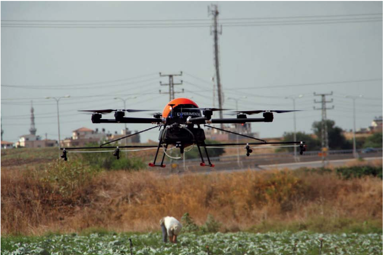
Drone para uso agrícola.

Embora a Netafim possa ser uma das empresas de agronegócios mais conhecidas de Israel e uma empresa regular nas delegações do governo Israelita, é propriedade do grupo mexicano Orbia, desde 2018. A Netafim realiza grande parte das suas vendas através de uma filial na Holanda, dando-lhe acesso preferencial a muitos mercados estrangeiros através de acordos comerciais e tratados de investimento da UE. Através desta configuração, pode aceder a mercados em África que têm restrições ao comércio com empresas Israelitas e obter financiamento de agências públicas Holandesas. 39