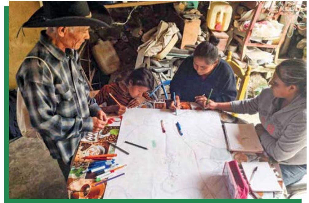
Atelier à Chila, Mexique, sur la reconstruction de l'histoire spatiale de leur région.