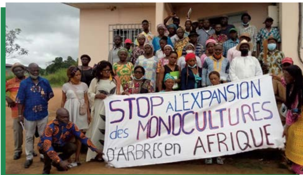
Réunion de Muyissi Environnement Gabon en marge de l'assemblée générale de l'Alliance africaine sur le palmier à huile à N'dolou à Mandji, avec une banderole sur laquelle on peut lire : « Stop à l'expansion des monocultures d'arbres en Afrique ».

14 Ce travail acharné et parfois éprouvant est absolument essentiel pour mettre un terme à l'expansion des plantations industrielles de palmiers à huile dans toute l'Afrique, et un mouvement international est un élément clé de la stratégie.