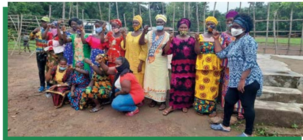
Des femmes de l'organisation Maloa, membre de l'Alliance sur le palmier à huile, se réunissent à Pujehun, en Sierra Leone.