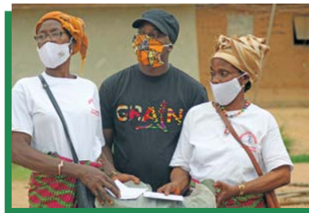
GRAIN et les membres de l'organisation Namané de Tchebloguhé se retrouvent à Daloa, en Côte d'Ivoire, pour une séance en présentiel sur l'agroécologie.

de soutenir les jeunes agriculteurs en formation pour qu'ils apprennent les pratiques et les politiques agroécologiques si l'on veut renforcer cette alternative dans la région.