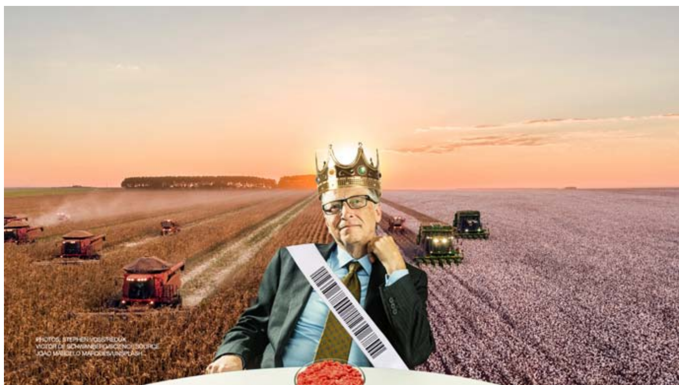
Gates : le nouveau roi du système alimentaire mondial ?