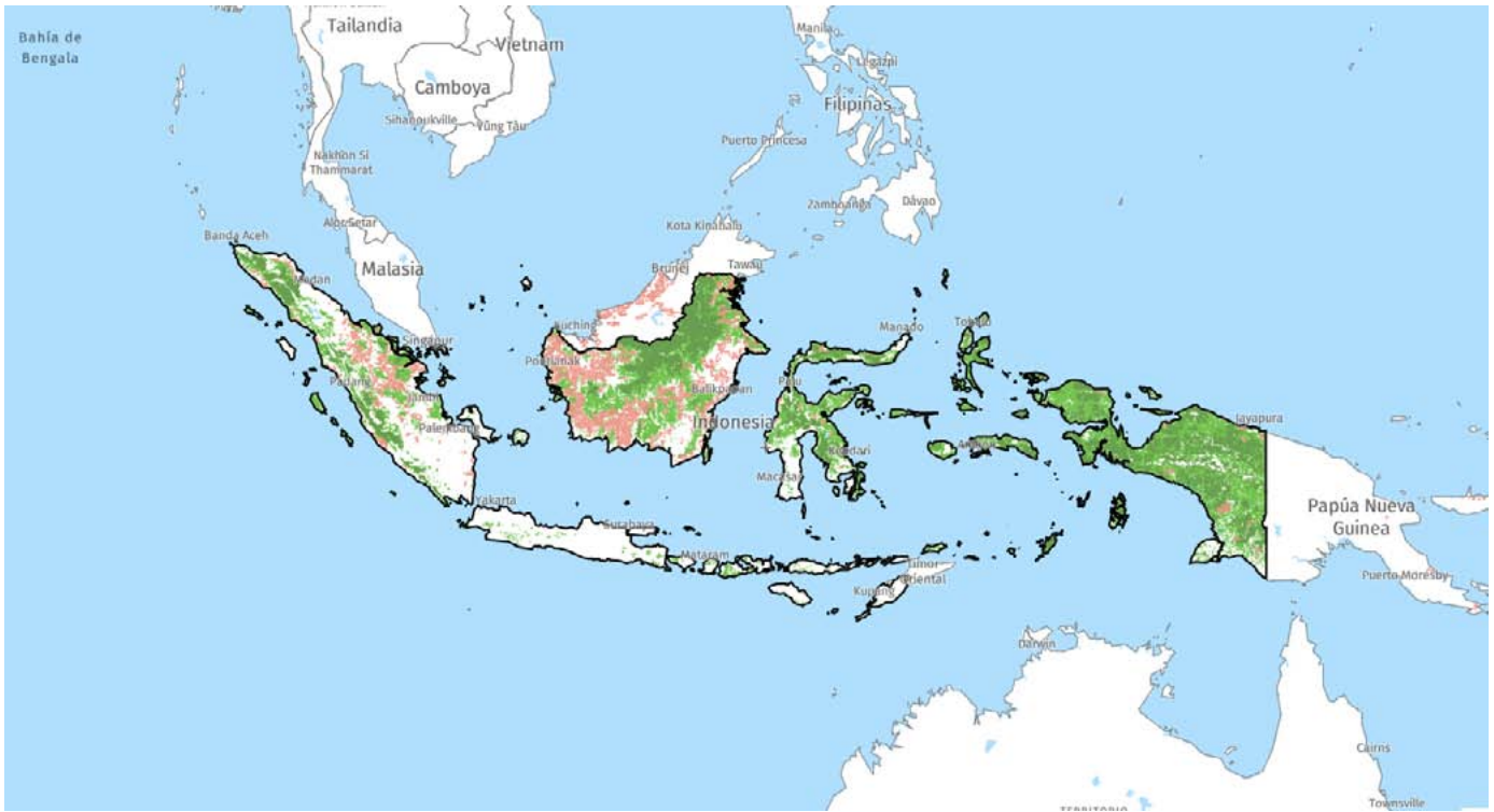
Carte des concessions de palmiers à huile en Indonésie (en orange).

biocarburants sur le marché au début des années 2000. Il prévoit d'étendre la superficie des plantations de palmiers à huile à 26 millions d'hectares. Cette industrie a commencé avec la création d'une première plantation commerciale de palmiers à huile par une société belge dans le nord de Sumatra en 1911 et son impact destructeur s'exerce aujourd'hui aussi bien sur les communautés que sur l'environnement.