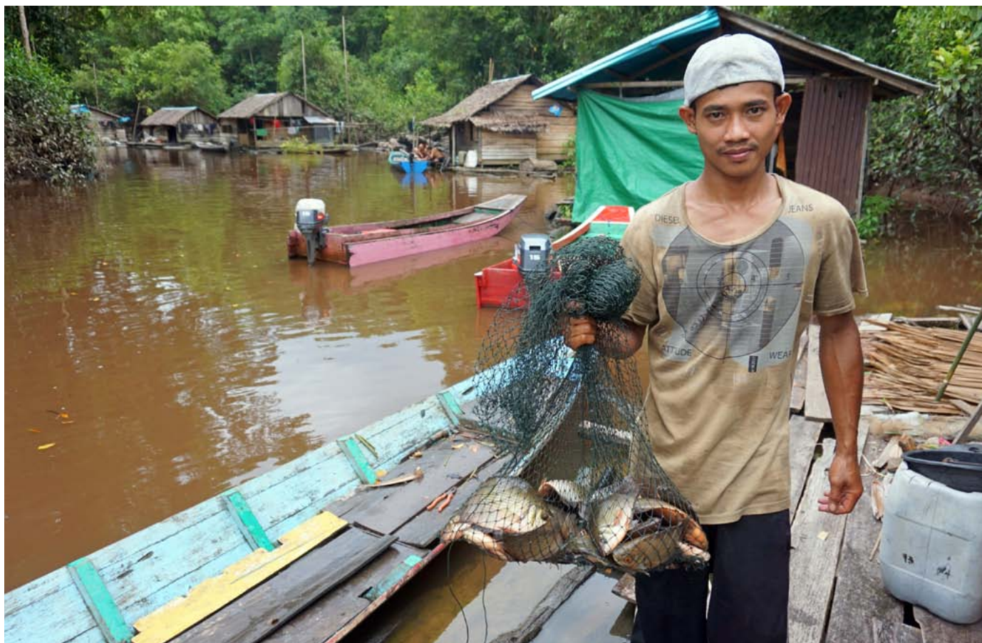
Pêcheurs dans la rivière Sambas.

La lutte contre l'accaparement de l'eau par les plantations de palmiers à huile