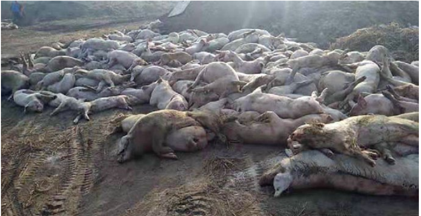
Cerdos muertos de un productor de cerdos chino, Sun Dawu, septiembre de 2019

Dan-Invest AS no resistió la enfermedad. En 2012 la empresa sufrió un brote que mató a 15 mil cerdos y luego otro en 2016 que mató a 31 mil. 21