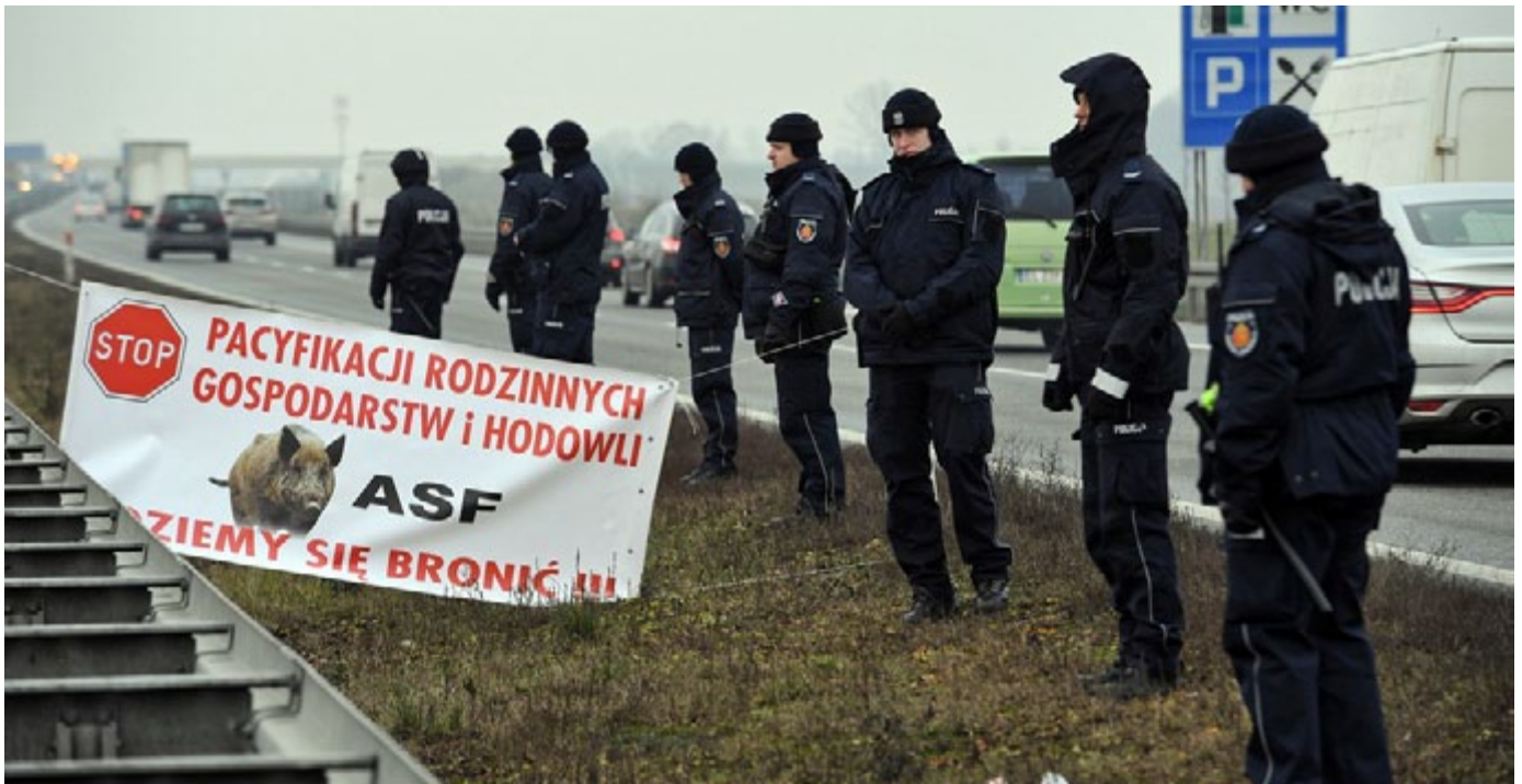
Productores polacos bloquean la autopista A2 en protesta por las acciones de su gobierno debido a PPA; Diciembre de 2018; Créditos: RMF24

cerdos cuando hay un brote cercano”, señala Attila Szöcs de la asociación de base de campesinos rumanos, Eco Ruralis. “Le disparan a los cerdos en la cabeza y los dejan para que el agricultor se haga cargo.” 52