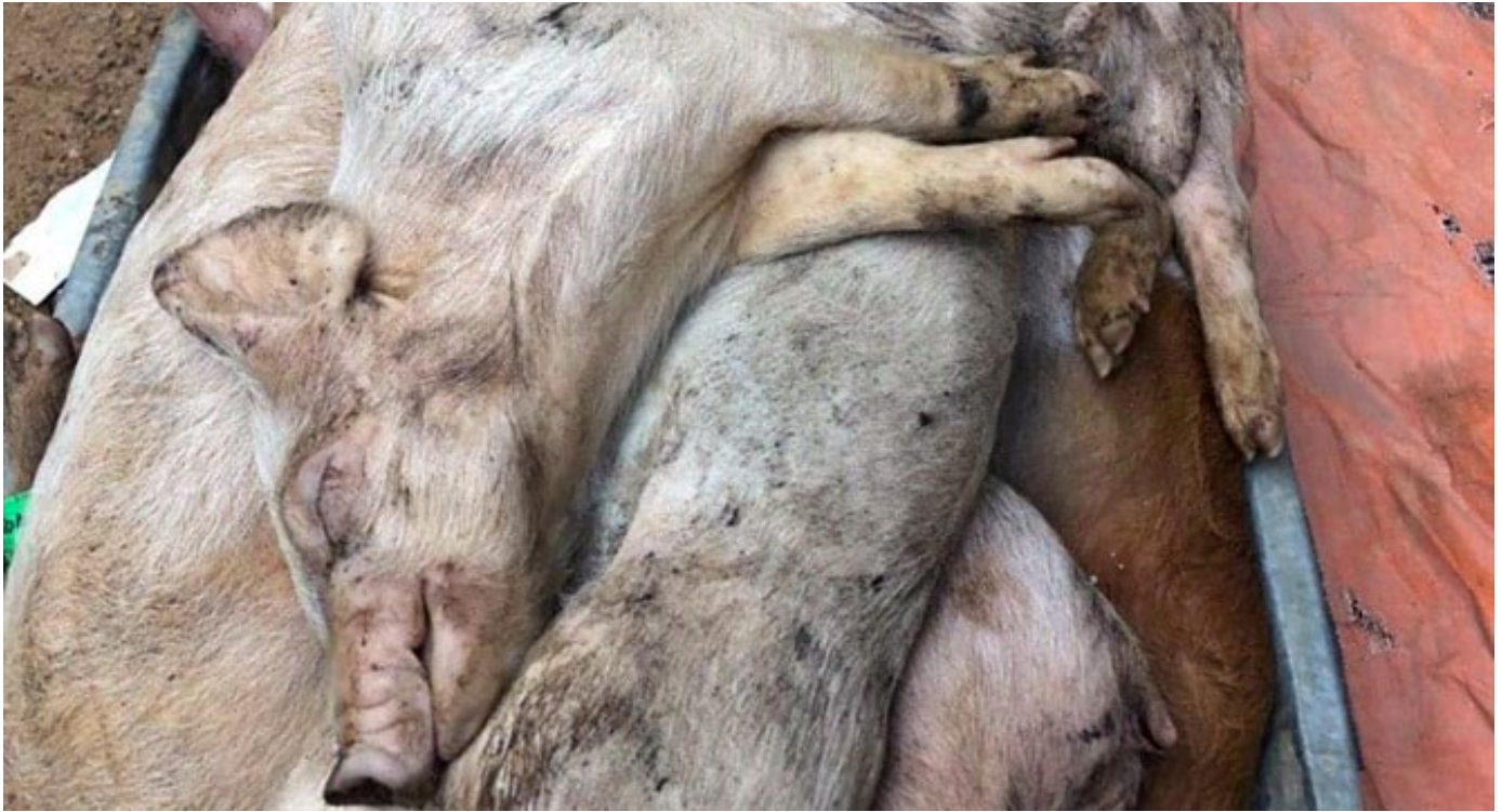
Cerdos muertos por PPA que fueron comprados a Mavin Group, provincia de Tuyen, Vietnam. Noviembre de 2019.

Rumania, por ejemplo, de propiedad de un empresario holandés, que nunca ha sido visto por las personas de la zona, recibió 36 millones 500 mil euros por parte de la UE cuando 200 mil de sus cerdos fueron eliminados por un brote de PPA en sus granjas rumanas de Gropeni. 48