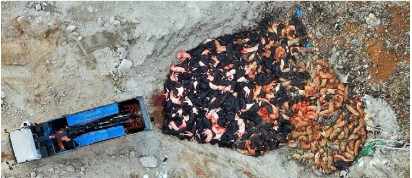
Eliminación de cerdos muertos, algunos envueltos en bolsas plásticas, luego que se detectara PPA en el matadero de Sheung Shui en Hong Kong, mayo de 2019.

2014, que derrumbó los esfuerzos de la compañía por resucitar la cría industrial de cerdos en el país. 12 Una reciente encuesta a nivel nacional sobre los cerdos en el país, no encontró evidencias de la enfermedad. 13