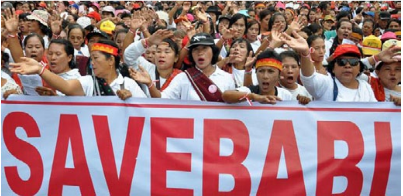
Personnes protestant contre un abattage massif de porcs prévu dans le nord de Sumatra, Indonésie, FÉV. 2020

sociétés d'élevage porcin, a ordonné l'abattage de tous les porcs détenus dans les petites exploitations dans un rayon de 20 km de chaque grande exploitation, alors même que les autorités étaient déjà complètement dépassées en essayant d'éliminer les cadavres de porcs dans les grandes porcheries. 45