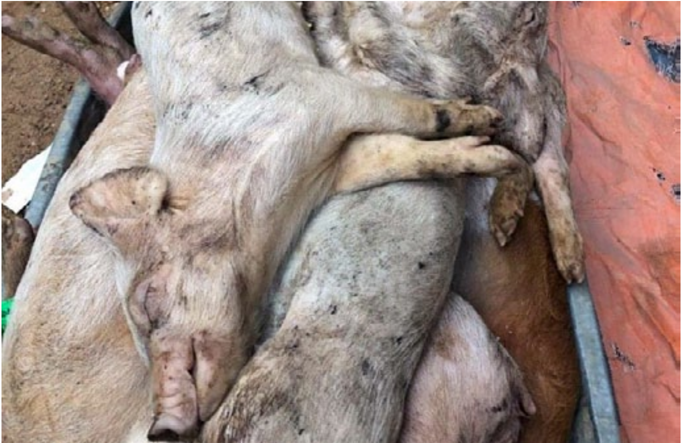
Porcs tués par la PPA qui ont été achetés au Groupe Mavin, province de Tuyen, Vietnam. NOV. 2019.

Les grandes entreprises d'élevage porcin peuvent ainsi rapidement reconstituer leur cheptel, et les autorités locales et nationales font généralement tout ce qu'elles peuvent pour que ces grands exploitants soient déclarés indemnes de la maladie le plus rapidement possible. Il y a même une pression au niveau de l'UE, à l'initiative de certaines des grandes entreprises danoises investies dans l'élevage porcin en Europe de l'Est, en faveur d'une « compartimentation » dans laquelle les sociétés exploitant de grandes fermes dans les zones touchées par la PPA obtiendraient une autorisation spéciale pour faire entrer ou sortir leurs porcs et leur équipement de la zone. 49