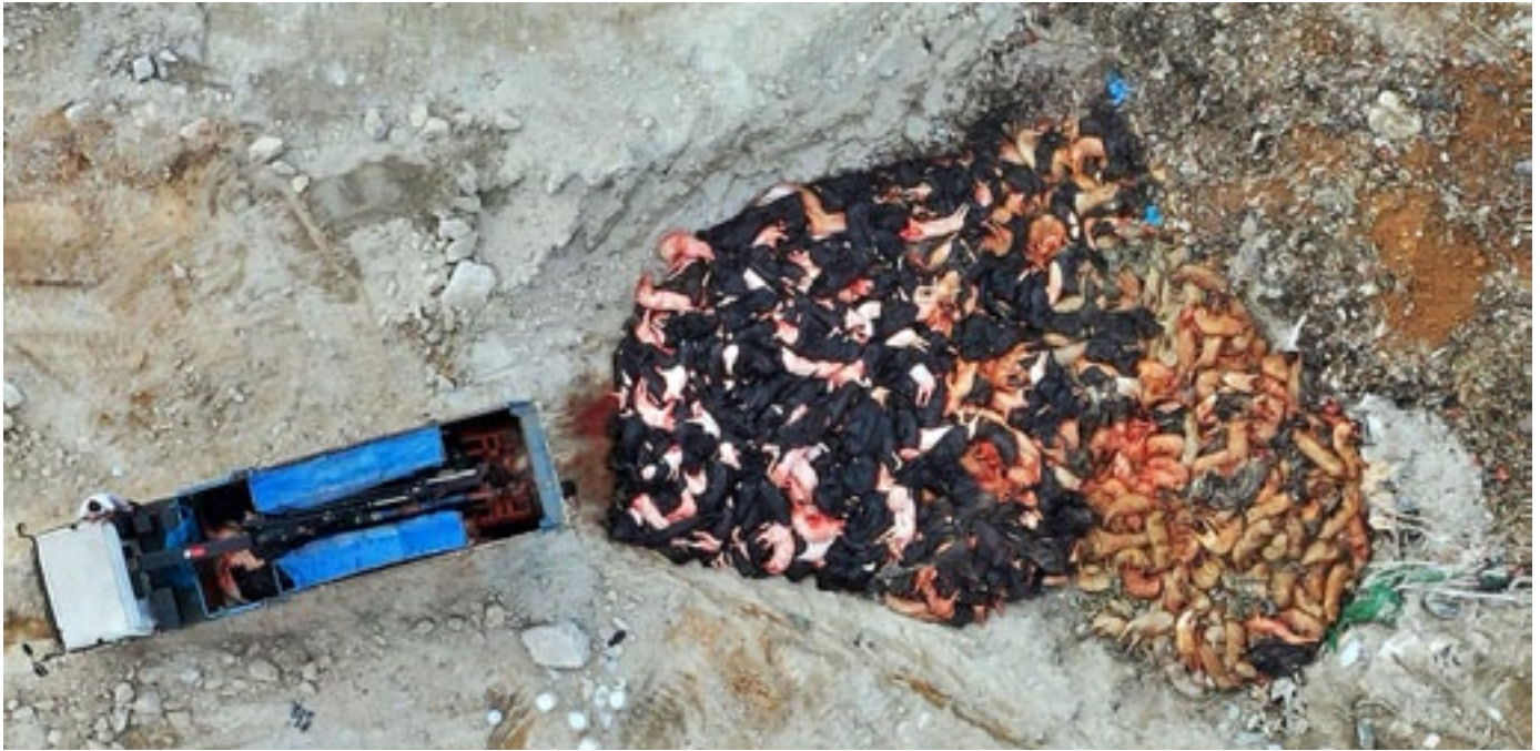
Élimination des cadavres de porcs, certains emballés dans des sacs en plastique, après la détection d'un foyer de PPA à l'abattoir Sheung Shui à Hong Kong, mai 2019.

Pourtant, malgré les sinistres prédictions d'organismes tels que l'Organisation des Nations Unies pour l'alimentation et l'agriculture (FAO), l'épidémie de PPA dans le pays a pris fin en moins d'un an. Aucun foyer n'a été officiellement déclaré après, même si l'on soupçonne que des cas se sont produits par la suite, notamment une épidémie majeure dans une nouvelle porcherie industrielle en 2014, qui a anéanti les efforts de l'entreprise visant à relancer l'élevage porcin industriel dans le pays. 12 Une récente enquête nationale sur les porcs domestiques n'a relevé aucune trace de la maladie. 13