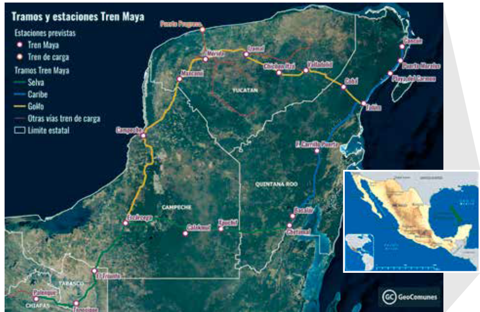
Mapa 1. Península de Yucatán situada en México mostrando el recorrido del Tren Maya y sus estaciones. Ver www.geocomunes.org

En los primeros anuncios, el titular de Fonatur promocionó el Tren Maya como un proyecto turístico que circundaría la Península con un tendido ferroviario aprovechando las vías ya existentes y se construirían nuevas, vinculando 18 ciudades (50 mil habitantes cada una) en una región habitada sobre todo por pueblos originarios. Ciudades con zonas “para gente modesta” que podría ir a trabajar a pie, pero también “pedir limosna si hace falta, pero