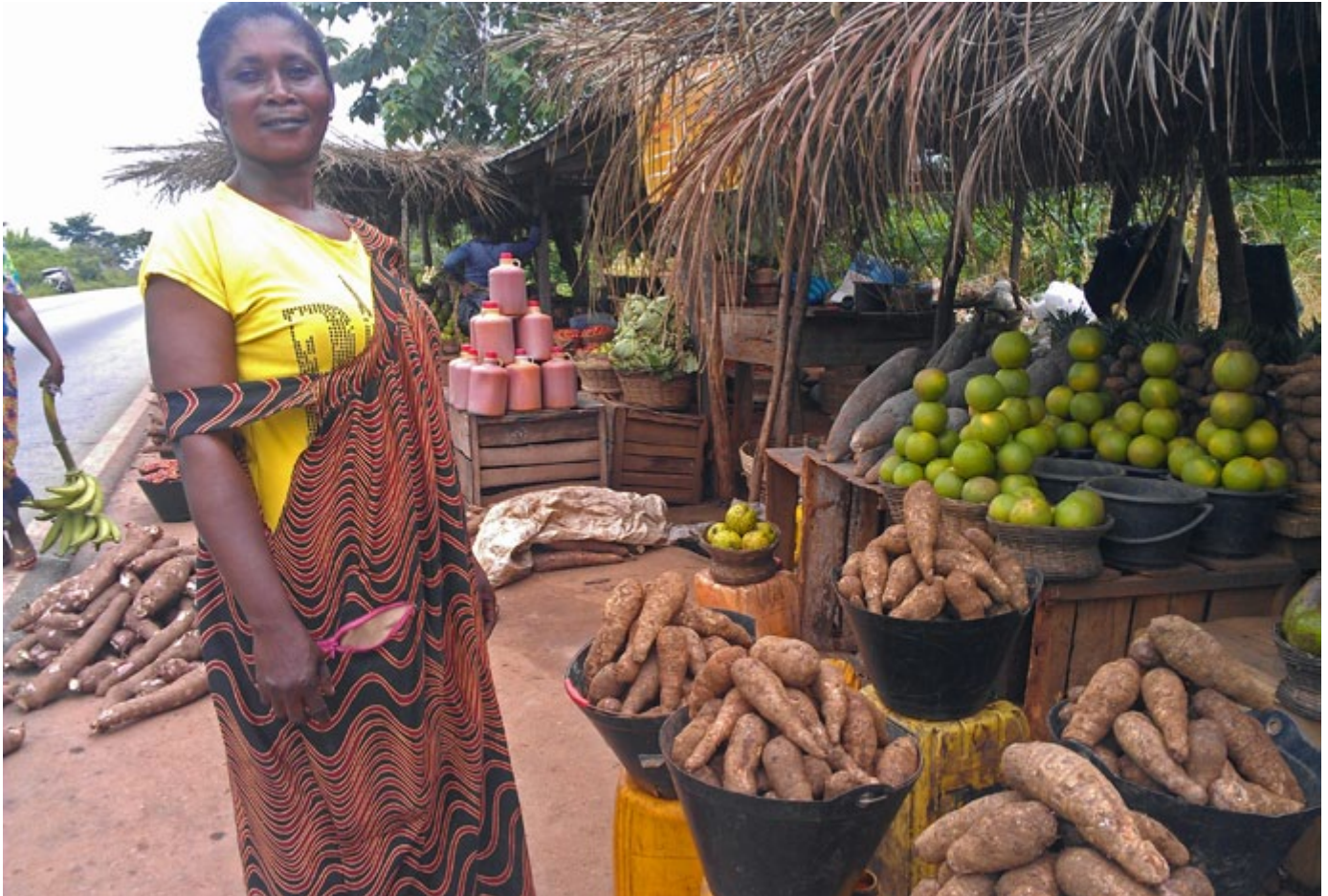
Una campesina y vendedora ambulante en Kumasi, Ghana.

adquirir solamente alimentos producidos localmente. 49 Pero se necesita una reorientación de las políticas públicas, más profunda y completa, por parte de los gobiernos africanos, para facilitar y apoyar la necesaria transición hacia la soberanía. En la Tabla anexa (Buen clima-mal clima), ofrecemos algunos ejemplos de lo que esto podría significar.