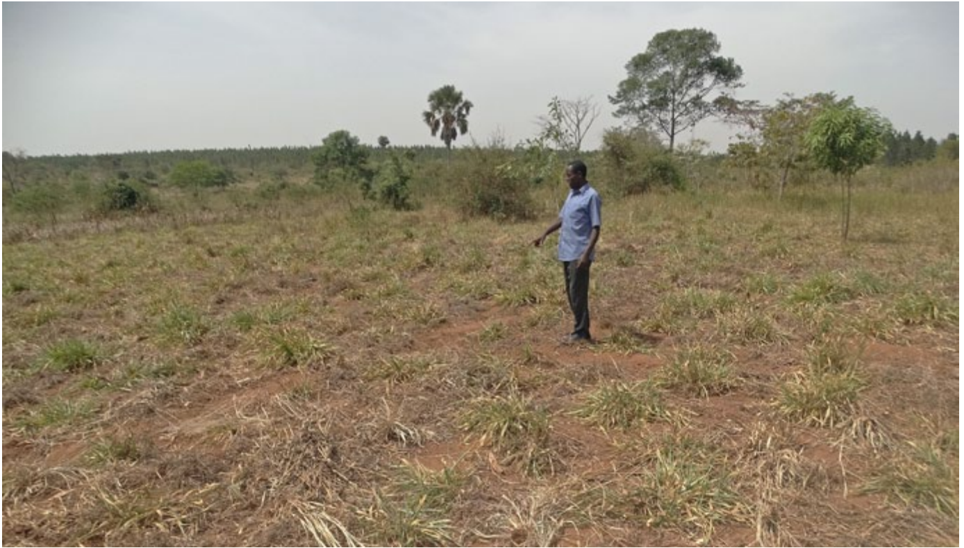
Hierba de pasto quemada por la sequía persistente en el distrito de Nakasongola, en Uganda central.

“La autosuficiencia alimentaria se logra mediante el apoyo gubernamental a la producción local, no a través de las corporaciones de los agronegocios y el comercio internacional.”