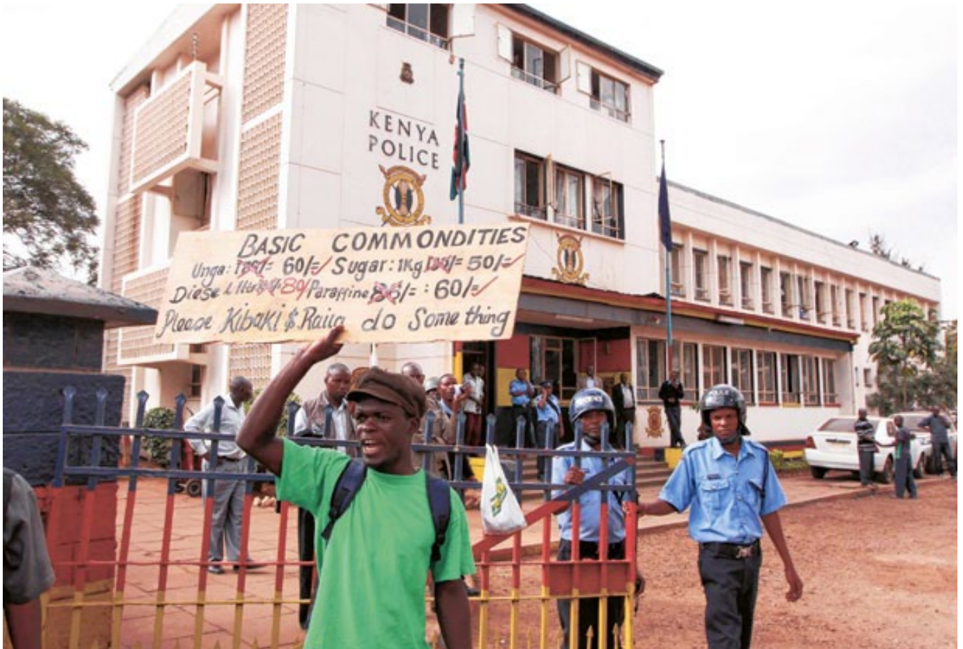
Una manifestación en Nairobi, Kenya, contra los altos precios de la comida. La protesta tuvo lugar en julio de 2011 en el marco de la Revolución Unga (Revolución de la harina de maíz).

ante la importación subsidiada de productos baratos. Muchas medidas fueron temporales, abiertas al abuso de los grandes comerciantes y traficantes o, simplemente, muy débiles. Respaldarlas se hizo con muy pocos recursos y no se logró hacer una diferencia. Más aún, muchos gobiernos africanos han firmado y/o están negociando tratados comerciales (incluido el reciente Tratado Continental Africano de Libre Comercio — AfCFTA) que hacen mucho más difícil la implementación de restricciones a la importación de alimentos y la protección para los productores locales de alimentos. 15