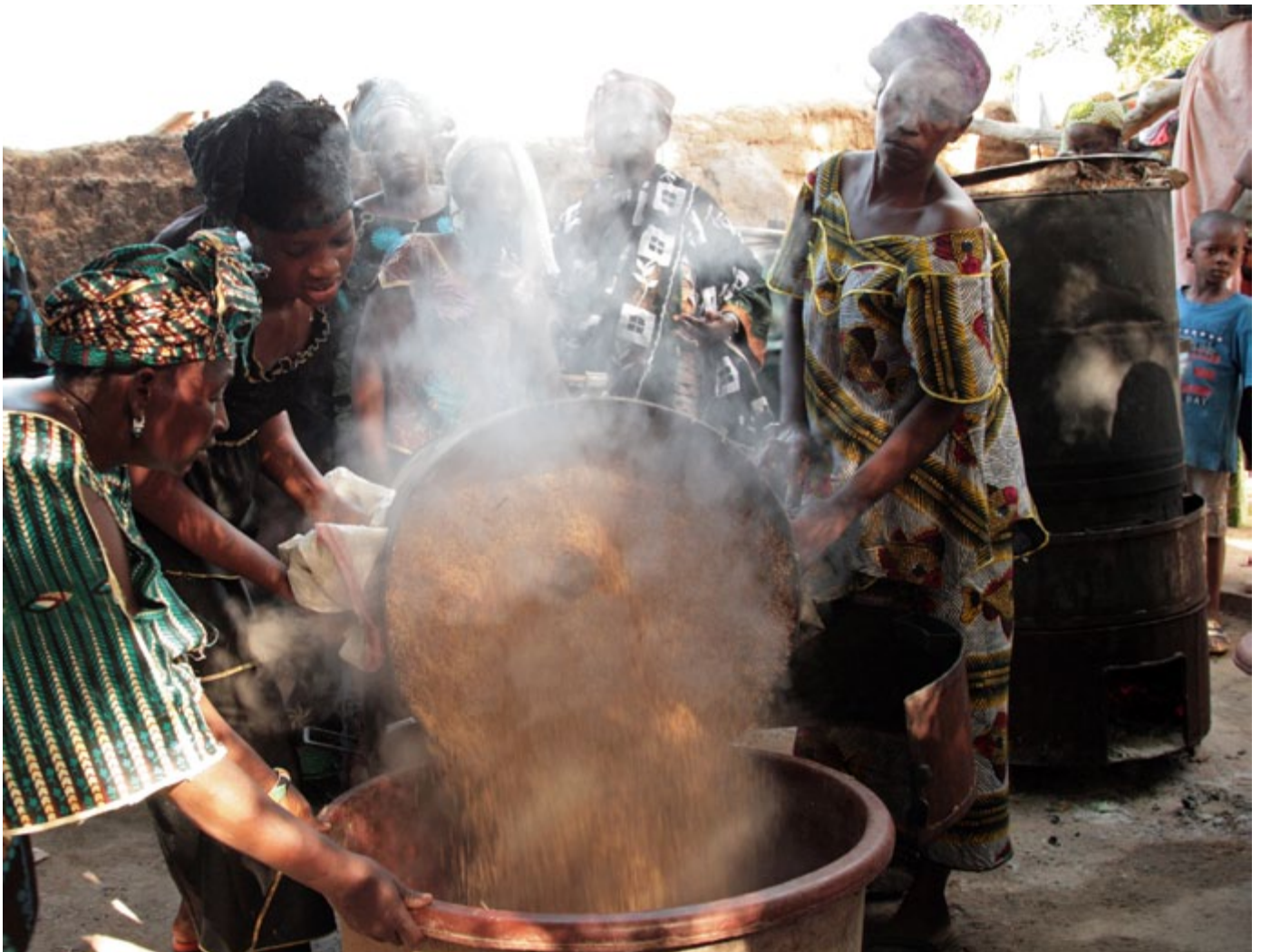
Procesamiento de una variedad local de arroz en una cooperativa de mujeres en Dioro, Mali.