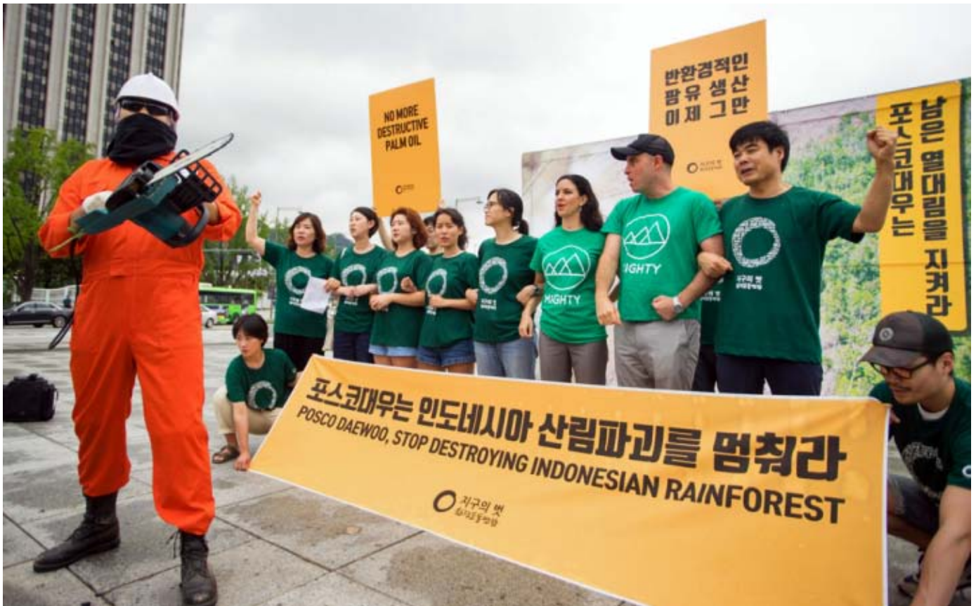
Des activistes sud-coréens manifestent contre la destruction de la forêt tropicale par le conglomérat coréen Posco Daewoo.

indonésienne, comme le constatait un rapport datant de 2013. 7 Selon TANY, une organisation malgache de défenseurs des terres, le fait que la Corée du Sud ait installé une ambassade à Madagascar en juillet 2017 confirme l'intention du gouvernement de relancer le projet. Le rapport de 2013 soulignait également la force des liens qui unissent le groupe Daewoo et le gouvernement sud-coréen. C'est pourquoi le collectif TANY a écrit une lettre ouverte à l'Ambassadeur de Corée à Madagascar, Kim Kwon-il, en janvier 2018 8 , demandant ce qu'il en était du projet agricole de 2008 et ce qui a été promis en échange des nombreux « cadeaux » et investissements sud-coréens concernant d'autres projets à Madagascar, dans le secteur des mines, de l'agriculture, de la pêche ou de l'énergie renouvelable.