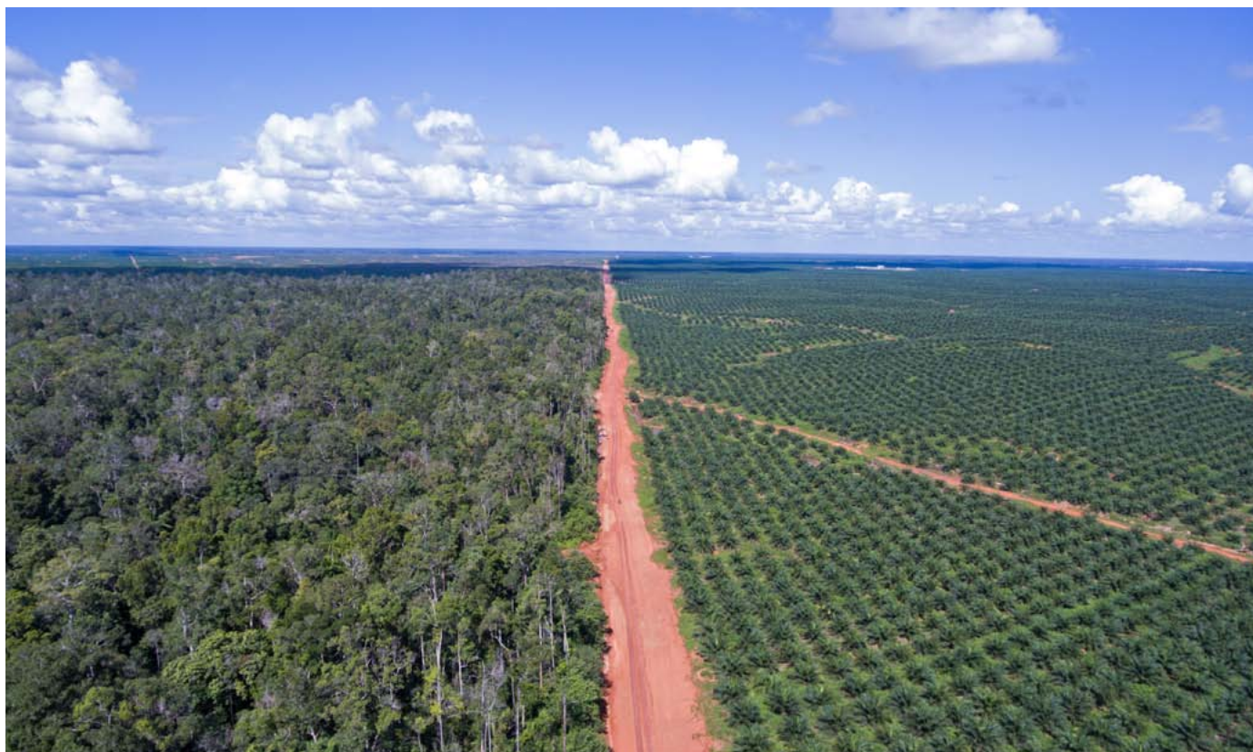
Limite entre la plantation de palmiers à huile PT.BIA de Posco Daewoo et la forêt existante en Papouasie (Indonésie).