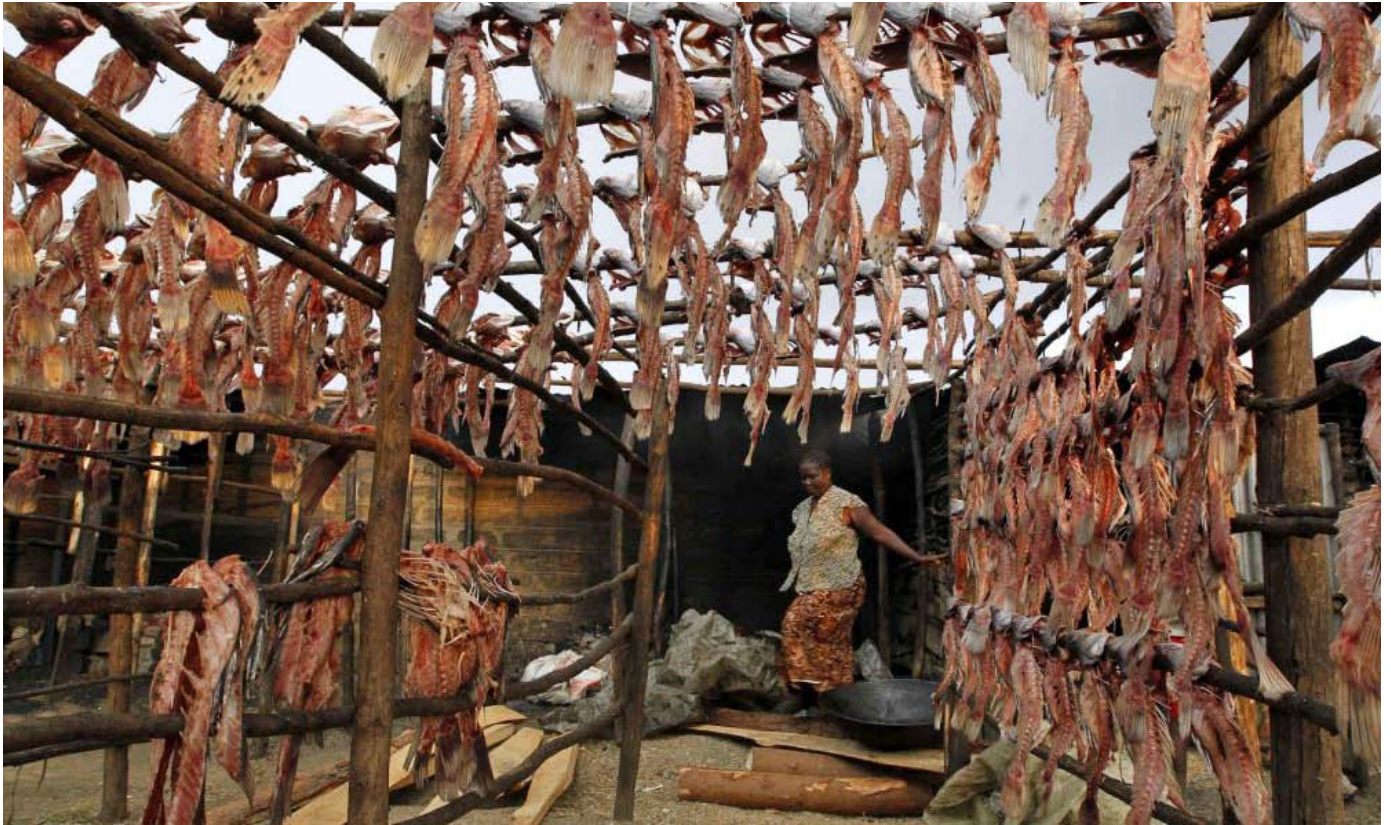
Mifupa ya samaki imeanikwa kwenye miti ya mbao katika soko moja huko Kisumu, Kenya. Mifupa hiyo ijulikanayo kama «mgongo wazi», imekaushwa na jua, halafu ikachemshwa na mafuta kabla ya kuuziwa wenyeji kama chakula cha bei nafuu.

kiwango cha ushuru cha 50%. Kwa upande mwingine, wanga wa mahindi (Kanuni ya HS, nambari 6 110812), itokayo kwa unga wa mahindi, haitoshwi ushuru. Haya mambo kana yanadhuru bidhaa nyingine, kama viazi. Katika ratiba hii, soko huru, kuongeza thamani kwa njia ya usindikaji wa bidhaa za kilimo utazuiliwa, na pia itaathiri uhakika wa chakula kwa sababu ya uhusiano wa kina kati ya kilimo na viwanda.