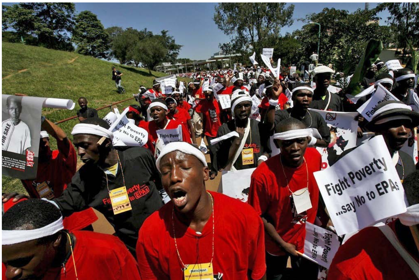
Jumuiya ya Jamii ya 2007: Wajumbe wanaadhamana Nairobi dhidi ya EPAs.

Mikataba ya Ushirikiano wa Kiuchumi kati ya Umoja wa Ulaya na Afrika