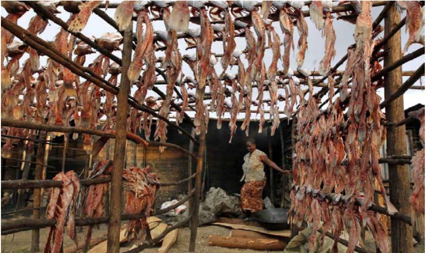
Des carcasses de poisson sèchent au soleil sur des piquets en bois dans un marché à Kisumu, au Kenya. Ces carcasses, appelées communément mgongo wazi , sont séchées au soleil et frites avant d'être vendues comme aliment bon marché.

système, auquel vient s'ajouter la production de fleurs, de cacao, de coton, de haricots verts et de café, voue essentiellement la production africaine aux exportations vers l'UE.