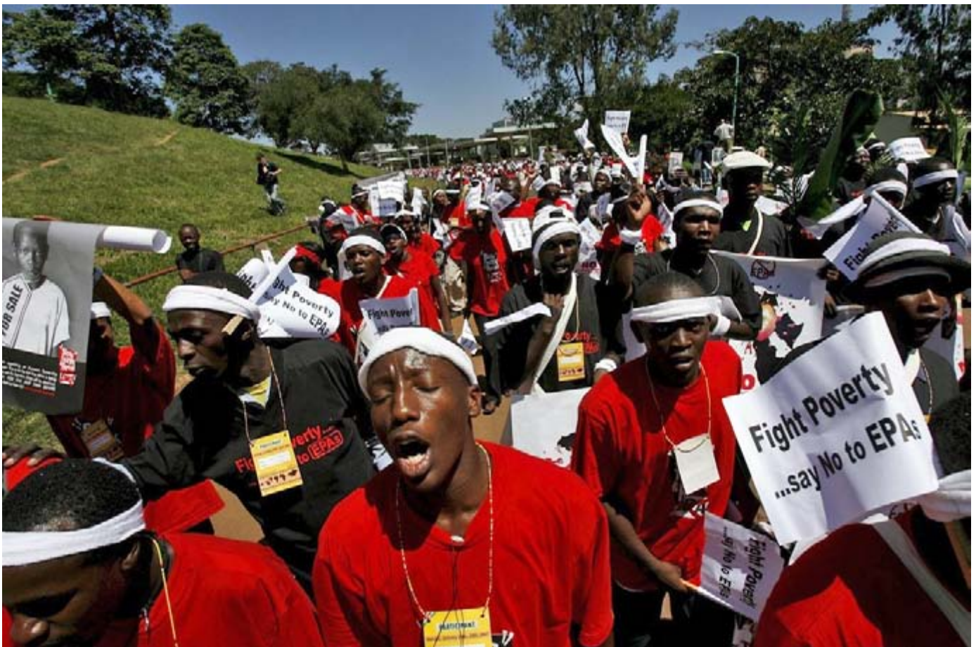
Forum Social Mondial 2007 : des délégués protestent à Nairobi contre les APE.

les accords de partenariat économique entre l'UE et l'Afrique