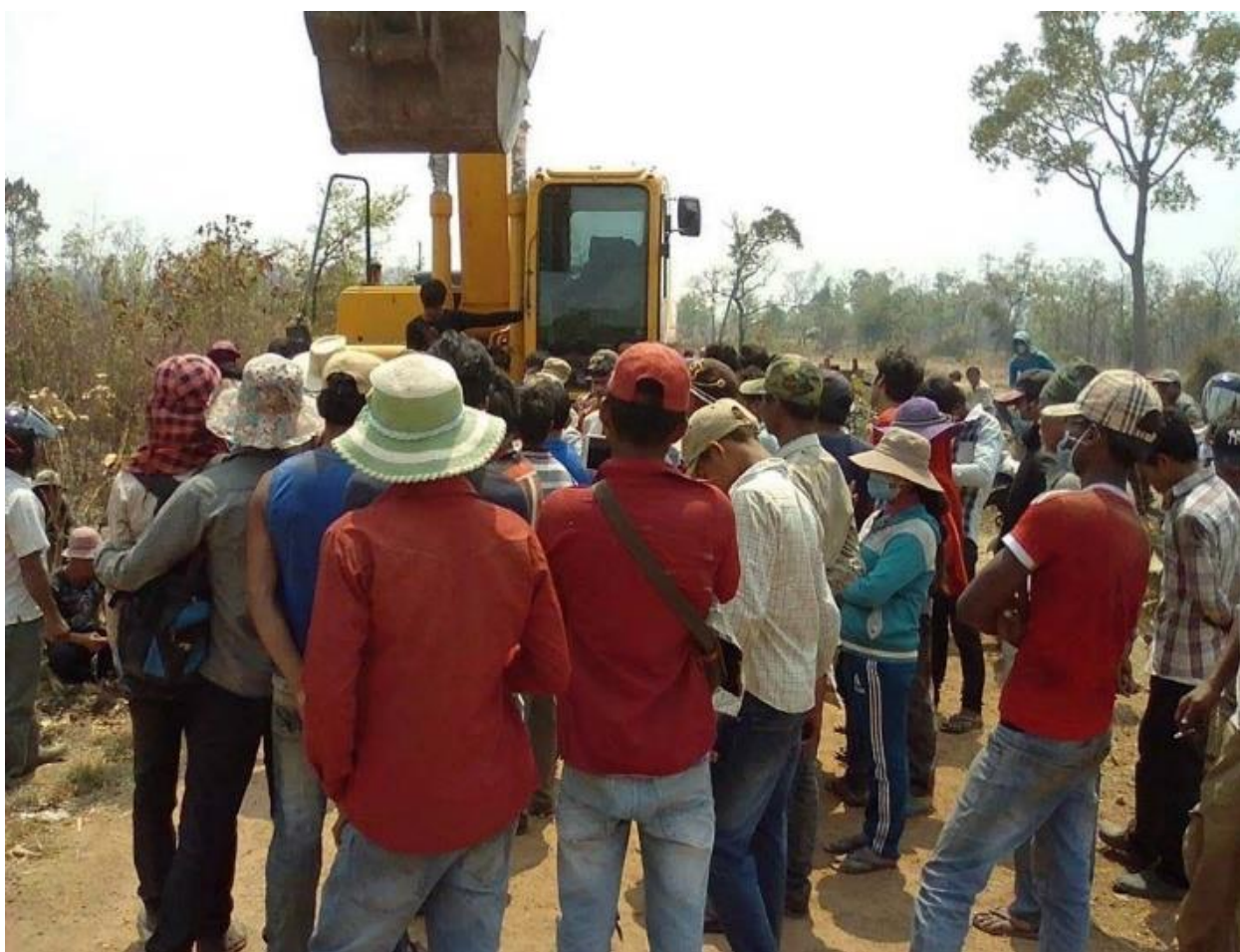
ប្រជាពលរដ្ឋទប់ស្កាត់ការឈូសឆាយដីរបស់ពួកគាត់ដោយផ្ទាល់

សហគមន៍ទាំងអស់នោះបានប្រើវិធីសាស្ត្រ ជាច្រើនរូបភាពក្នុងការទប់ទល់ជាមួយក្រុមហ៊ុន សម្បទានស្តុរអំពៅ។ ភាគច្រើនគាត់បានចាប់ផ្តើម ដោយតវ៉ាផ្ទាល់ជាមួយអ្នកបើកបរគ្រឿងចក្រដែល កំពុងឈូសដីរបស់គាត់ ហើយសកម្មភាពនោះ បានឈានដល់ការចរចាជាមួយអាជ្ញាធរមូលដ្ឋាន ៤៣ ។ ប្រជាពលរដ្ឋក៏បានធ្វើពាក្យបណ្តឹងជាលាយ លក្ខណ៍ក្រុមហ៊ុនដល់អាជ្ញាធរខេត្ត និងស្ថាប័ន រដ្ឋនៅថ្នាក់ជាតិ តែស្ទើរតែគ្មានលទ្ធផល ៤៤ ។ សហគមន៍នៅឃុំប្រមេរ ស្រុកត្បែងមានជ័យបាន ប្តឹងក្រុមហ៊ុន និងអ្នកបរគ្រឿងចក្រអោយក្រុមហ៊ុន ដាក់ទៅតុលាការខេត្តព្រះវិហារ ៤៥ តែតុលាការ តម្កល់ទុកមិនចាត់ការ។