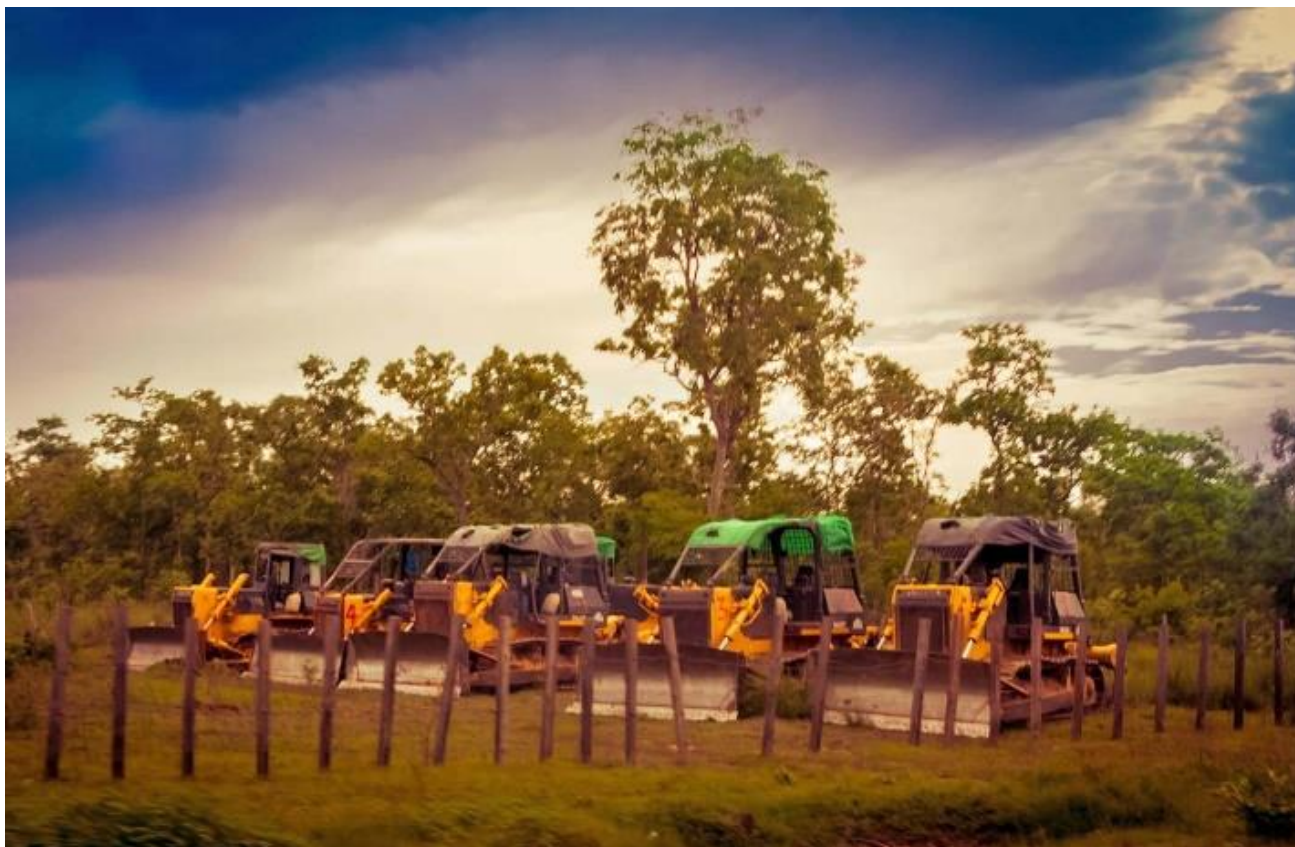
សហគមន៍បានឃាត់គ្រឿងចក្ររបស់ក្រុមហ៊ុនទុកនៅក្នុងភូមិរបស់ពួកគេ

ធានាទាំងអស់នេះកំពុងរងការបំផ្លាញ ដោយព្រៃ ឈើ អូរ ត្រពាំង ស្រែ និង វាលស្មៅត្រូវបានកែប្រែ ទៅជាចំការអំពៅ។ ក្រុមហ៊ុនបានកាប់ដើមឈើដុះ ទឹករាប់ម៉ឺនដើម ដោយផ្តល់សំណងតិចតួចណាស់ ថែមទាំងនិយាយថា បើទទួលសំណងក៏កាប់ មិន ទទួលក៏កាប់ ២៨ ។ នៅពេលត្រពាំង និងអូរបាត់បង់ មធ្យោបាយដែលប្រជាពលរដ្ឋធ្លាប់អាស្រ័យជា អាហារក៏បានបាត់បង់ដែរ។ តំបន់ជាច្រើនសម្រាប់ ឃ្វាលគោក្របីបានបាត់បង់ផងដែរ ២៩ ។ នៅស្រុក ជ័យសែន ប្រជាពលរដ្ឋក៏បានរាយការណ៍ថា មេ ការចិនម្នាក់បានបាញ់សម្លាប់ក្របីមួយក្បាលរបស់ ប្រជាពលរដ្ឋដើម្បីយកទៅហូប ហើយទឹបញាប់បាន បង់ប្រាក់ជាសំណង។ នារីម្នាក់ឈ្មោះសុផល រស់ នៅភូមិមួយនៅស្រុកឆែបដែលទទួលផលប៉ះពាល់ ពីក្រុមហ៊ុន បាននិយាយថា ៖