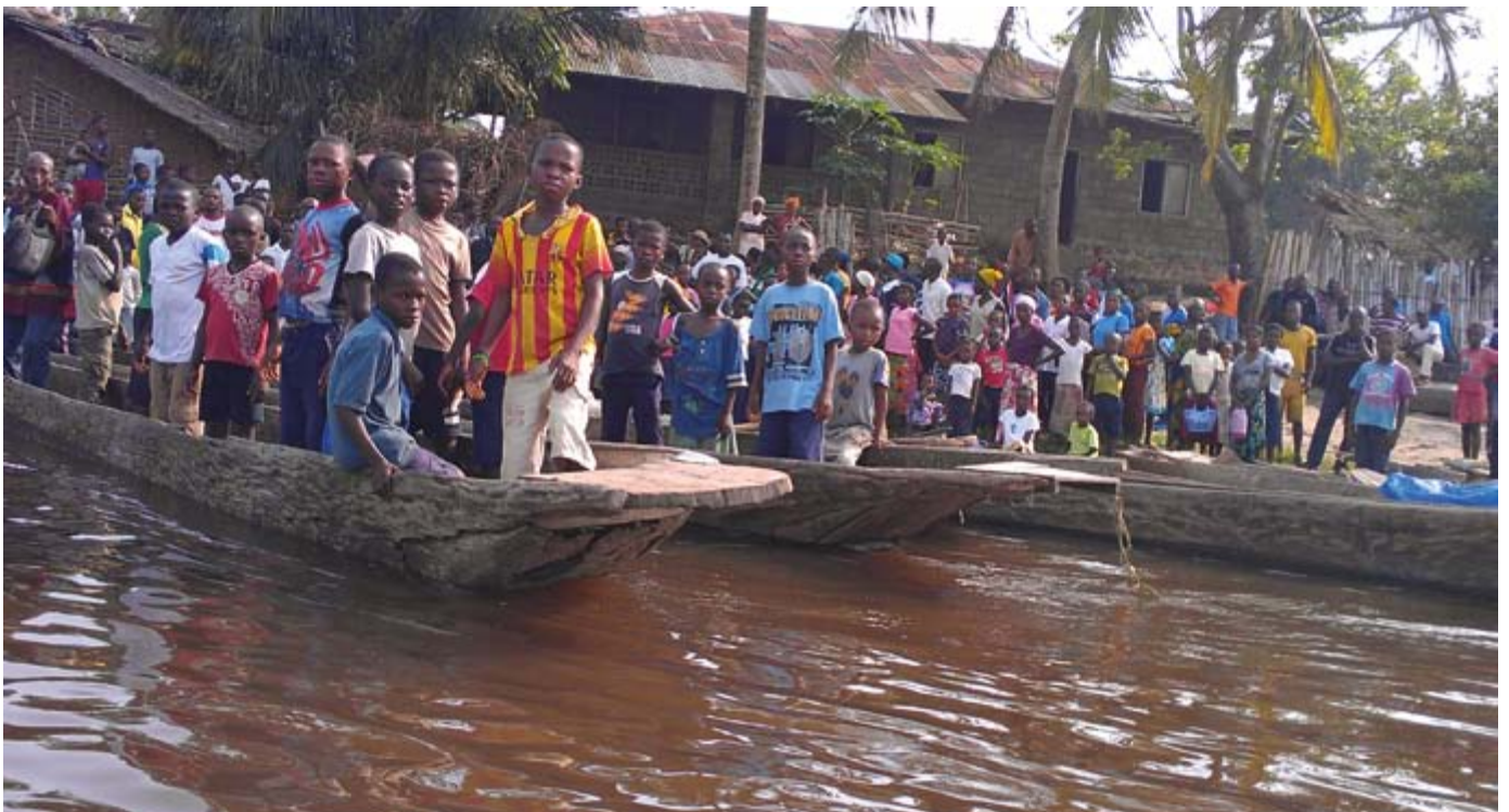
Enfants sur le quai de Lokutu sur le fleuve Congo.

Les institutions financières de développement européennes et américaines financent une nouvelle phase d'agro-colonialisme au Congo