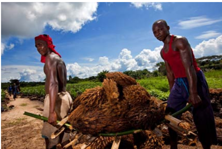
Des ouvriers de la plantation de palmiers à huile de Lokutu

Responsable ), qui lui interdit « d'investir dans toute activité qui entraîne un risque inacceptable ou de se rendre complice d'activités ou d'omissions qui violeraient ses propres principes, comme les violations des droits humains, la corruption ou les impacts sociaux ou environnementaux négatifs. » 15