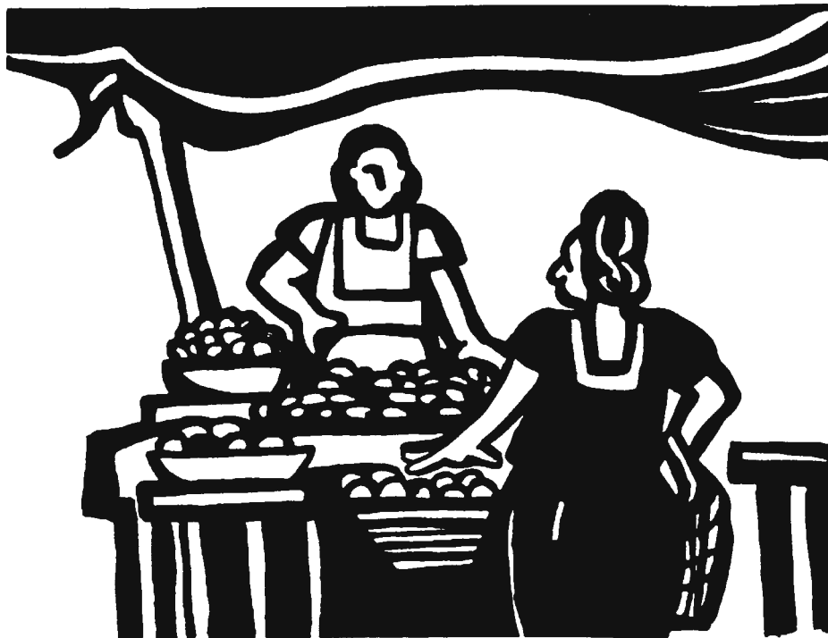
Puesto callejero. Dibujo: Rini Templeton

Hacia 2012, las cadenas minoristas habían desplazado a las tiendas como fuente principal de venta de comestibles, con 35% del mercado nacional, mientras las tiendas mantenían un 30% y los mercados callejeros el 25%. 24 Según la Cámara Mexicana de Comercio cierran cinco tiendas por cada tienda de conveniencia que abre. 25