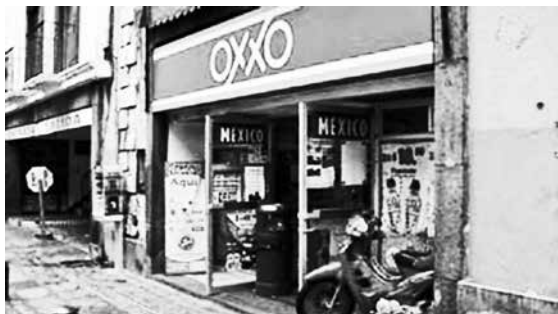
Uno de los 14 mil mini-supers Oxxo en México.

y tiendas de conveniencia, “de menos de 700 a 3 mil 850 tan sólo en 1997, y 5 mil 729 en 2004”. 21 El éxito de Wal-Mart en el país —hoy por hoy “la cadena minorista líder de la nación”— y de otros supermercados, sólo la sobrepasa el crecimiento de las “cadenas de tiendas de conveniencia” (que venden “un número limitado de artículos y productos de conveniencia las 24 horas al día”).