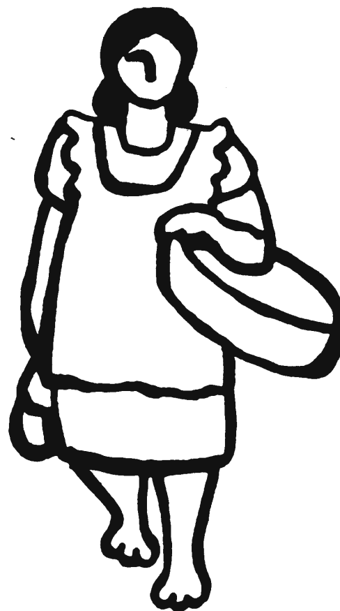
Dibujo: Rini Templeton

Las tiendas están perdiendo terreno ante los minoristas corporativos que le ofrecen a las compañías procesadoras mucho más oportunidades para vender y ganar.