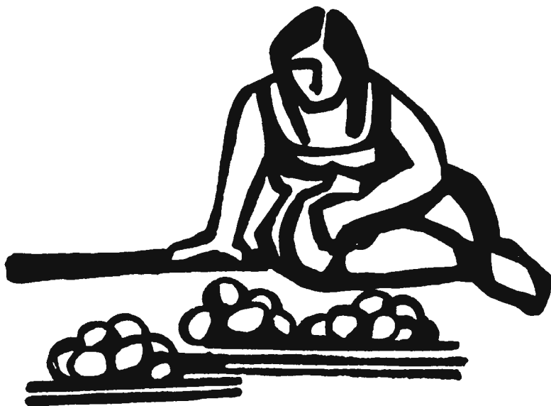
Puestos callejeros. Dibujo: Rini Templeton

derosos: “deslocalización de la producción y comercio global de la comida; inversión directa en el procesamiento de alimentos y un cambio en la estructura del menudeo (es notable el advenimiento de los supermercados y las tiendas de conveniencia); la emergencia de las agroempresas globales y las compañías alimentarias transnacionales; la profundización de la promoción y publicidad global de los alimentos”. 8 Los instrumentos del TLCAN también promovieron el desarrollo de reglas e instituciones globales “que gobiernan la producción, el comercio, la distribución y la mercadotecnia de los alimentos”, y “la compra de productos y servicios de marca”, algo que crea “incentivos para que las transnacionales alimentarias crezcan mediante integración vertical y dislocación”. 9