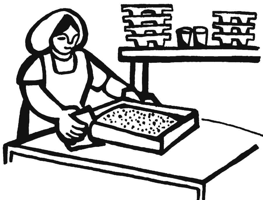
Panadería de barrio. Dibujo: Rini Templeton