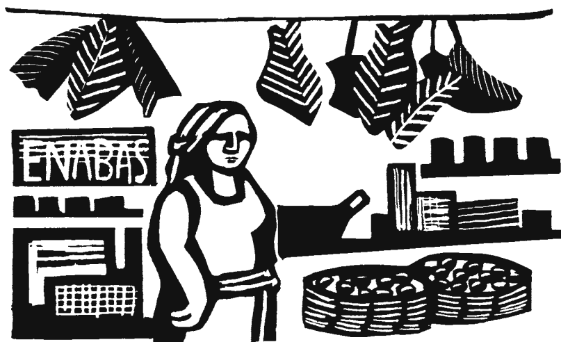
Tienditas de barrio. Dibujos: Rini Templeton