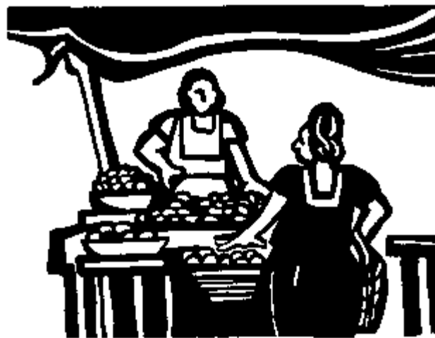
Poste de bouffe rapide de rue. (Dessin: Rini Templeton)

PepsiCo, par exemple, en même temps qu'elle distribuait ses boissons gazeuses aux tiendas , commercialisait un grand nombre de variantes de ses pommes de terre frites de marque Sabritas et d'autres amuse-gueules semblables, tout comme sa gamme de bonbons Sonric's. Chaque produit atteint des volumes de vente énormes grâce à ce que l'industrie appelle « le contrôle absolu du point de vente. » Ainsi, la disponibilité est devenue le facteur clé dans l'achat et la consommation. Les gens consomment ce qu'ils ont à la main, et les articles disponibles sont presque exclusivement des aliments transformés.