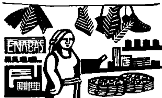
Tiendita o miscelánea de barrio. (Dibujo: Rini Templeton)

En 2014, el gobierno mexicano, bajo presión para lidiar con la creciente crisis de salud, puso en vigor una ley para aplicarle 8% de impuestos a todos los alimentos empacados con alto contenido calórico, incluida la mantequilla de maní (o cacahuete) y los cereales endulzados para desayunar. Aprobó también un impuesto