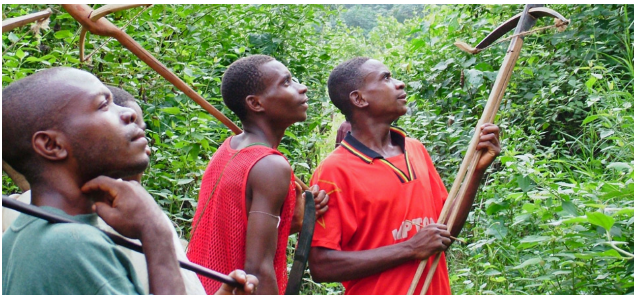
Cazadores Bagyeli.