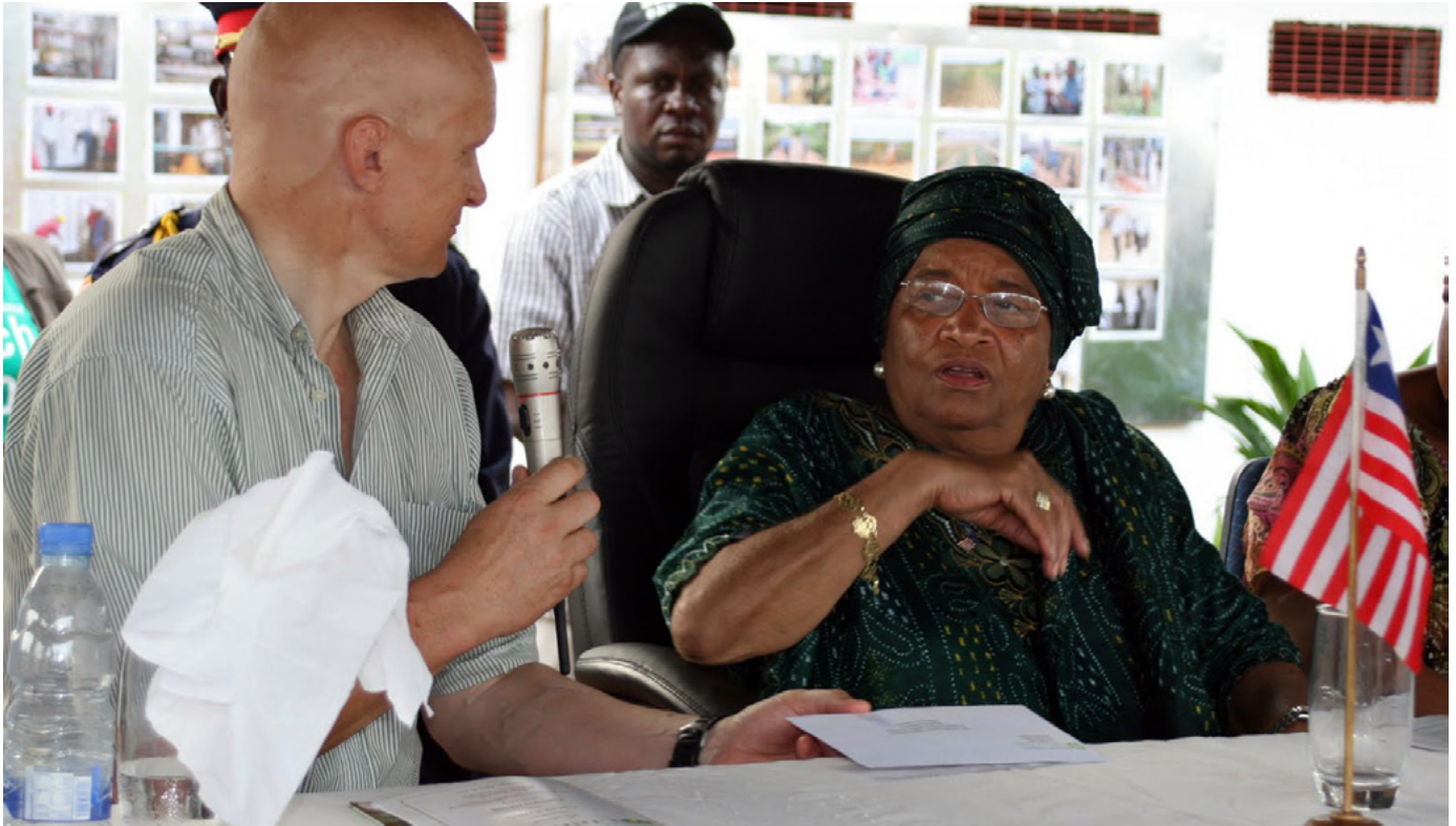
En abril de 2011, los medios de Liberia informaron que el director de EPO, Peter Bayliss le entregó a la presidenta Sirleaf un sobre con un cheque por 25 mil dólares durante un evento público en una visita al sitio de la concesión

Condado de Grand Bassa. Esa concesión tiene una larga y controvertida historia que se remonta a 1966 cuando 14 mil ha fueron asignadas a una compañía de Liberia de propiedad del hombre más rico de los Estados Unidos, J. Paul Getty, sin la consulta a los pueblos locales. 9 Getty no llegó muy lejos con el desarrollo de plantaciones antes de vender la tierra en 1980 a Joseph Jaoudi, el hijo de uno de los hombres de negocio más ricos de Liberia y amigo familiar cercano de la actual presidenta liberiana, Ellen Johnson Sirleaf. El también tuvo problemas para llevar a cabo la plantación. Para la fecha en que el acuerdo de arriendo terminó en 2006, sólo un tercio de las tierras había sido limpiada.