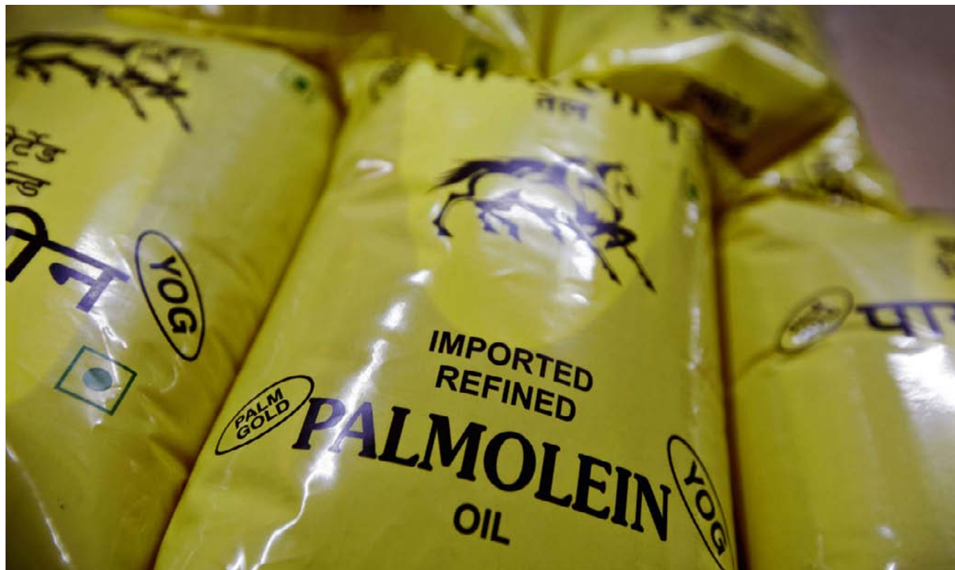
Bags of imported palmolein oil are stored at a warehouse of a cooking oil wholesaler in Mumbai.

Les communautés qui vivent sur les terres ne sont qu'un détail, un obstacle potentiel pour ceux qui n'ont qu'une idée en tête, faire de l'argent. Mais ce sont elles qui paient, en fin de compte.