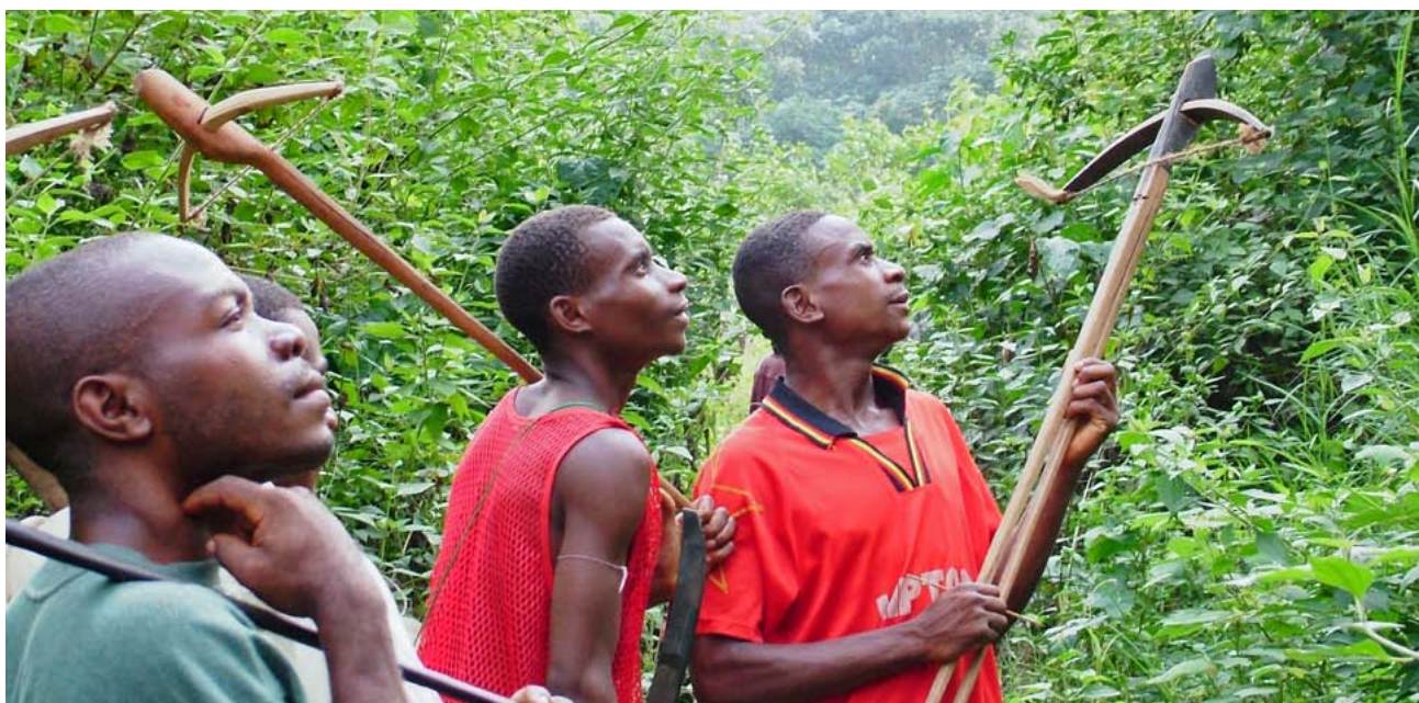
Chasseurs bagyeli