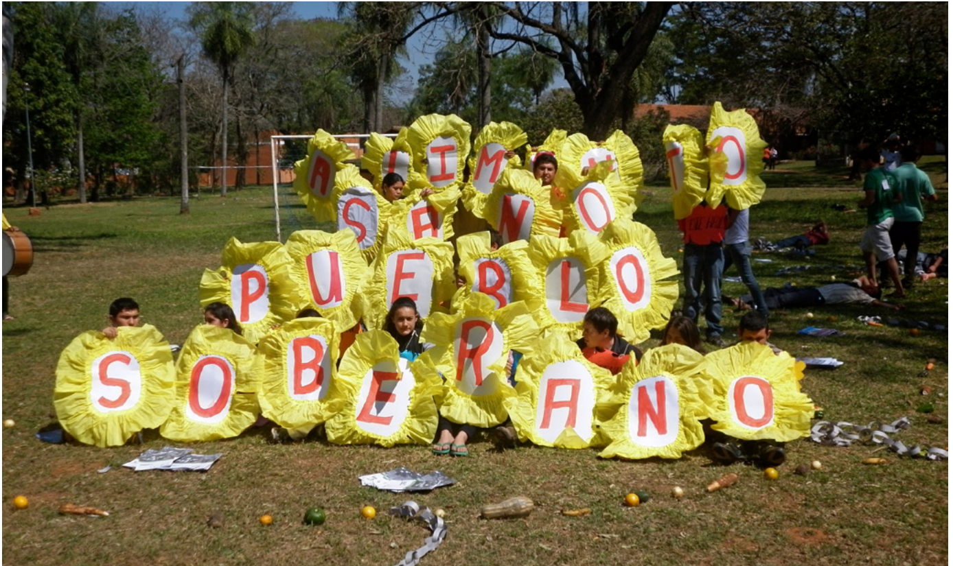
Forum pour la souveraineté alimentaire, les aliments sains et le peuple souverain à Asunción, Paraguay, septembre 2011.

montée. Zuccolillo est aussi le président de la Société interaméricaine de presse SIP. 33