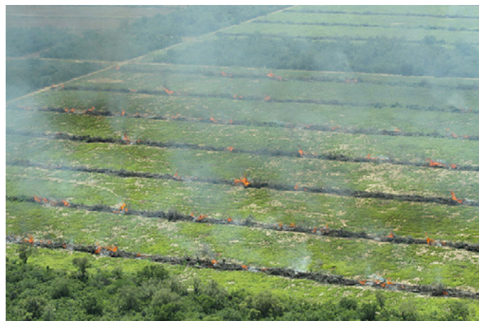
Des arbres récemment abattus brûlent dans la région de Boqueron au Paraguay.

Ce bilan régional nous permet de conclure qu'au moins 600 millions de litres de glyphosate sont appliqués chaque année, une statistique inquiétante qui est accompagnée d'innombrables dénonciations faites à tous les jours pour les dommages déjà décrits à la santé, aux écosystèmes, à l'agriculture et aux communautés que cause un tel bain d'agrottoxiques.