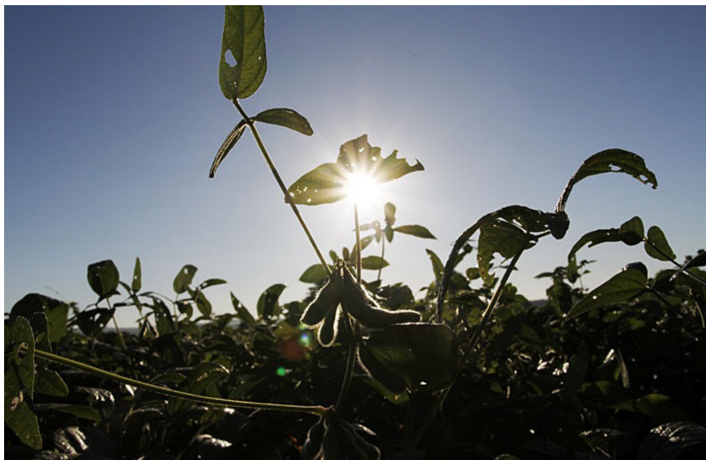
Plantation de soja, Paraguay.