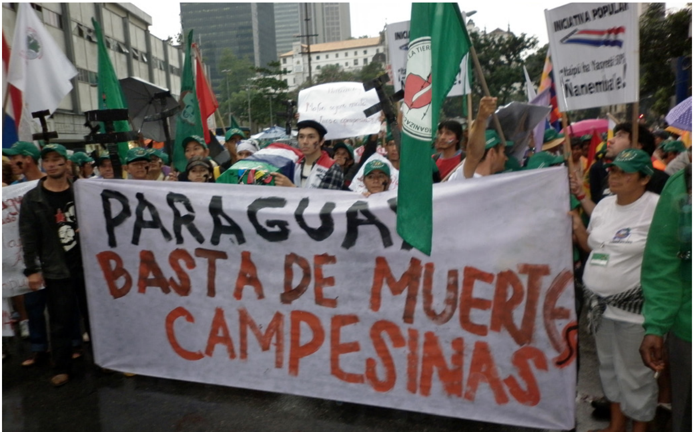
Les organisations paysannes de La Via Campesina du Paraguay à la marche du Sommet des peuples à Río + 20, juin 2012 - quelques jours après la tuerie de Curuguaty.

Les effets nocifs du « modèle » sont importants et se font sentir tant à la campagne qu'à la ville : populations fumigées à la campagne et dans les zones périphériques des villes, paysans et paysannes déplacés gonflant quotidiennement les ceintures de pauvreté des grandes cités, économies régionales détruites avec des prix de denrées élevés et des aliments contaminés rendant les uns et les autres malades. Bref, une catastrophe socio-environnementale qui prend l'eau de toutes parts et qui ne permet plus de « détourner le regard. »