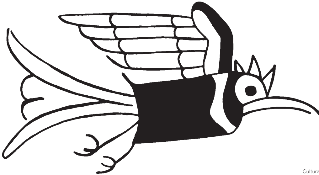
Cultura moche, Perú

les y aisladas herméticamente, aún así existen riesgos. Pero estos procedimientos distan muchísimo del cultivo masivo al libre ambiente de millones de hectáreas de cultivos transgénicos que interactúan con el ecosistema, que se convierten en nuestra comida y en parte de nuestro propio organismo con efectos aún inciertos. Además, los fármacos no son en sí organismos transgénicos, son subproductos (como la insulina) que no contienen los transgenes y son consumidos sólo eventualmente, a diferencia de los alimentos transgénicos (como la soya o el maíz), que consumimos directamente, casi a diario y que contienen en sí mismos a los transgenes, que la mayoría de las veces incluyen material genético de virus y bacterias infecciosas. Cualquier científico, con algo de ética, supondría de inmediato que esto implica riesgos.