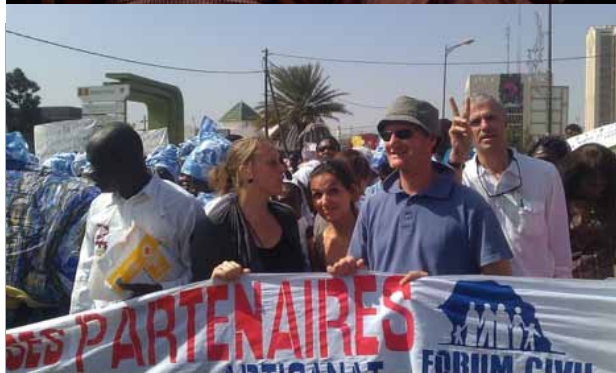
Arriba: Campesinas entregan leche en una fábrica de yogurt en el poblado de Bogru, Bangladesh. La feabrica es propiedad de una empresa conjunta entre Danone y el banco de micro-créditos Grameen.