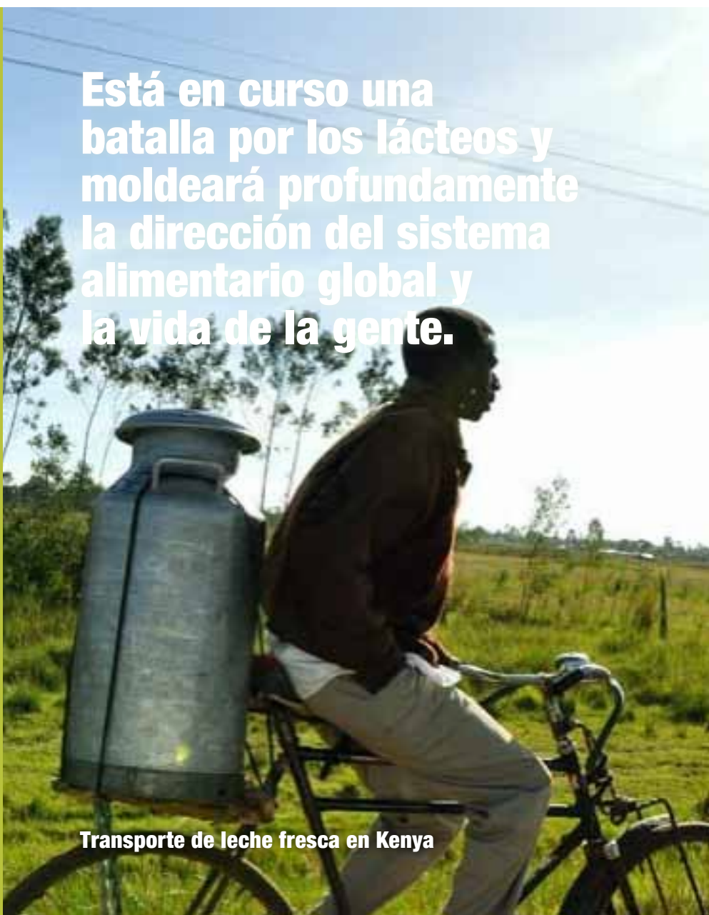
Transporte de leche fresca en Kenya

Está en curso una batalla por los lácteos y moldeará profundamente la dirección del sistema alimentario global y la vida de la gente.