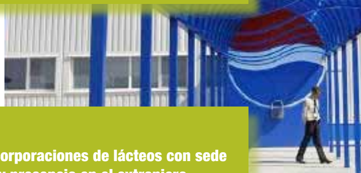
Tabla 5. Algunas corporaciones de lácteos con sede en el Sur y presencia en el extranjero