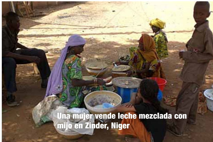
Una mujer vende leche mezclada con mijo en Zinder, Níger