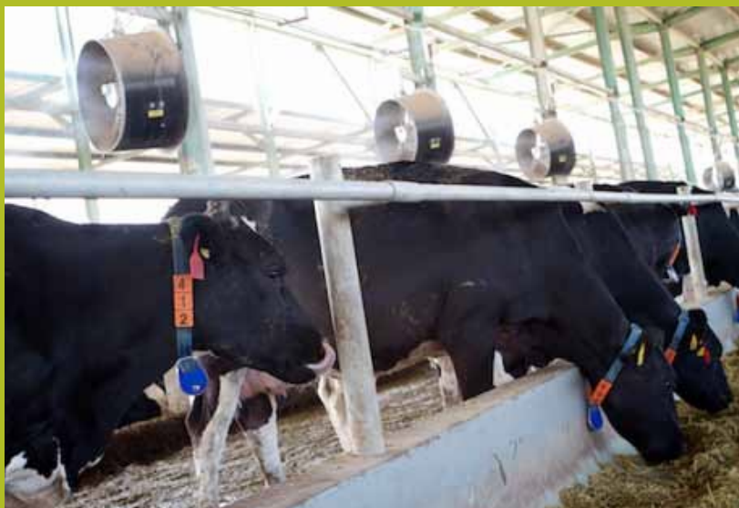
Dina Farms, Egipto

73 Para acceder al relato detallado de este acaparamiento del sector lácteo uruguayo ver: "Agazzi: un mala leche", El Muerto Blog, 21 de junio, 2009: http://elmuertoquehabla.blogspot.com/2009/06/agazzi-un-mala-leche.html