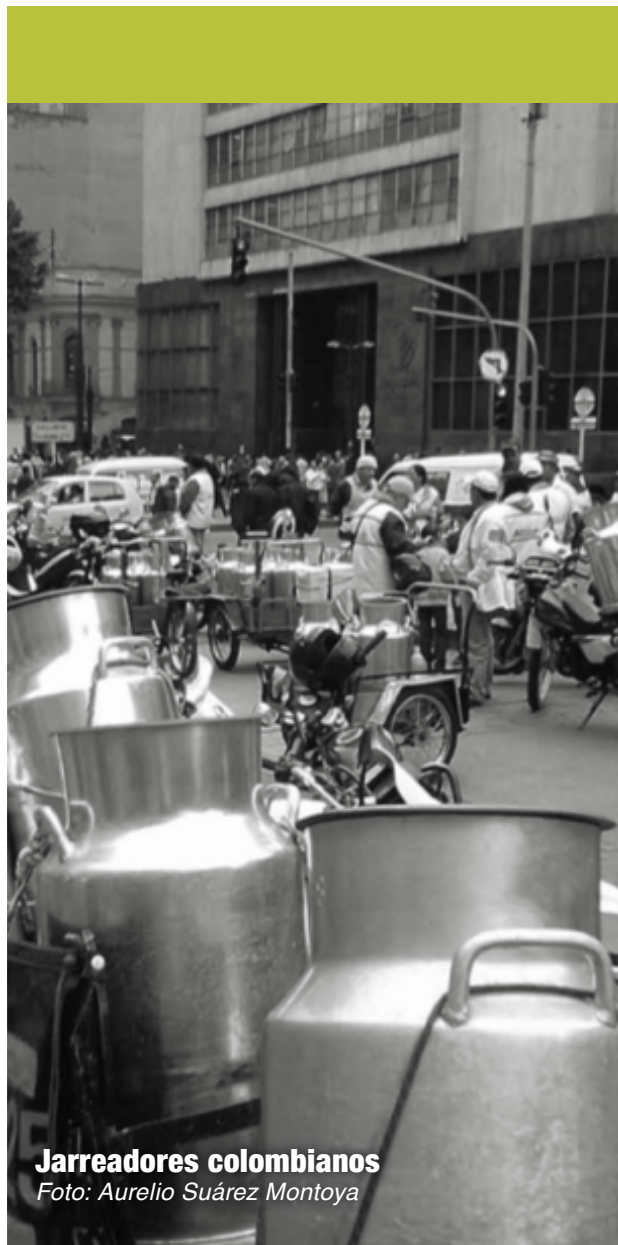
Jarreadores colombianos

[o cadena láctea popular] estará en el centro y al frente cuando el pueblo colombiano logre quebrar las políticas del gobierno y plantee un nuevo camino de transformación social. 2