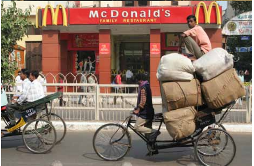
Arriba: La granja lechera Ancali , propiedad de Carlos Heller, heredero de la fortuna de la familia Falabella —una de las dinastías más acaudaladas de Chile, con acciones importantes en el comercio al menudeo, bienes raíces y transportes. La granja cuenta con 6 mil 500 vacas, y produce 7 millones 500 mil litros de leche mensuales..