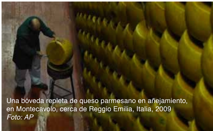
Una bóveda repleta de queso parmesano en añejamiento, en Montecavolo, cerca de Reggio Emilia, Italia, 2009

B ajo el sistema de indicadores geográficos de la Unión Europea (IG), el queso vendido como Parmigiano-Reggiano sólo puede producirse en Parma, Reggio Emilia, Modena, Bologna o Mantua. Sin embargo, en 2008, la Unión Europea dictaminó que lo mismo se aplicaba a todo el queso producido con el nombre de “parmesano”, un término genérico utilizado ampliamente en quesos que se producen por todo el mundo. La UE emitió una reglamentación semejante para el Feta, alegando que sólo podía producirse dentro de Grecia, pese a que el nombre “Feta” se ha vuelto genérico y común en muchos países no pertenecientes a la UE donde se producen quesos que también