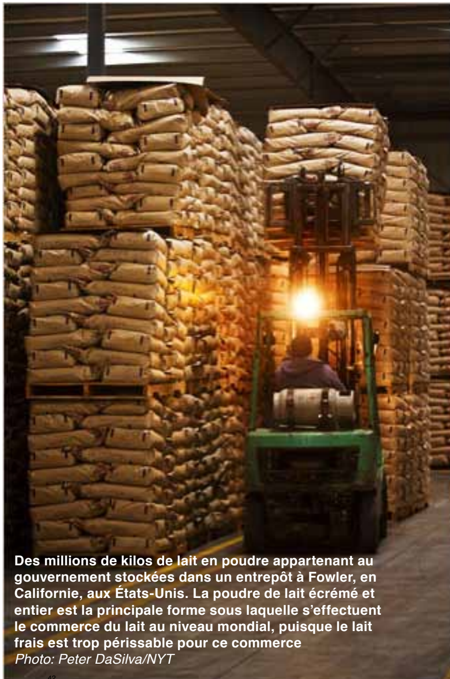
Des millions de kilos de lait en poudre appartenant au gouvernement stockées dans un entrepôt à Fowler, en Californie, aux États-Unis. La poudre de lait écrémé et entier est la principale forme sous laquelle s'effectuent le commerce du lait au niveau mondial, puisque le lait frais est trop périssable pour ce commerce

La possibilité pour les pays du Sud de maintenir ou de mettre en place des droits de douane ou d'autres protections commerciales sur les produits laitiers est sous la menace de la multitude d'accords commerciaux bilatéraux et régionaux mis en œuvre et négociés à travers le monde. Dans la négociation de ces accords commerciaux, l'UE, l'Australie, la Nouvelle-Zélande, les États-Unis, l'Argentine et d'autres exportateurs insistent pour que les pays importateurs ouvrent leurs marchés à leurs produits laitiers et se conforment à d'autres exigences qui protègent les intérêts des exportateurs (voir photo p. 21). L'UE et les États-Unis ne veulent pas pour autant soumettre leurs propres industries laitières à la même concurrence étrangère (voir Encadré 2: La crise du lait dans l'UE en passe de s'aggraver , p. 8). 42