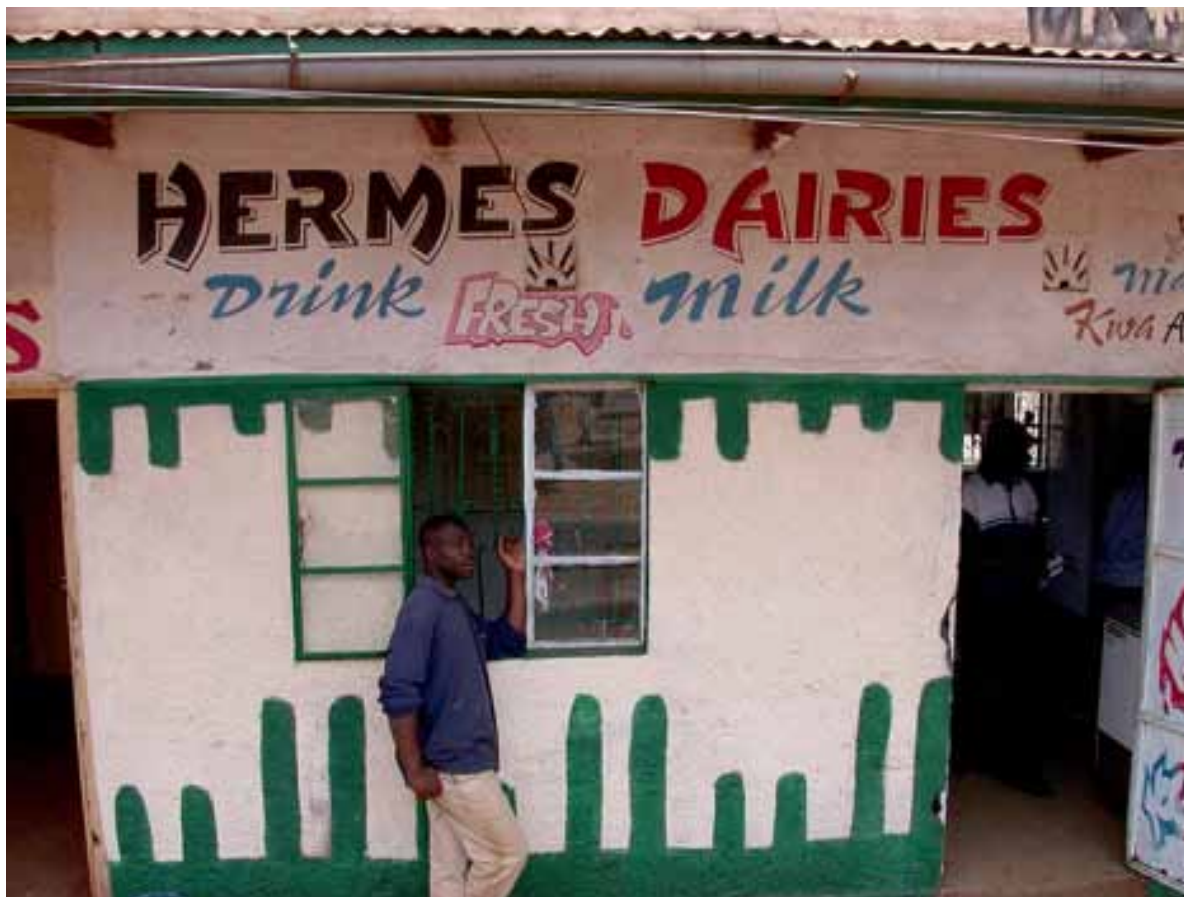
Un bar à lait au Kenya, qui sert du lait frais produit localement...

Au Kenya, Nestlé refuse même d'acheter du lait auprès des producteurs laitiers traditionnels, malgré des siècles d'expérience dans la production d'un lait de grande qualité. La société affirme que le lait produit et transformé au Kenya ne répond pas à ses normes et, à la place, il utilise du lait en poudre importé, principalement de Nouvelle-Zélande. Récemment, la société a lancé un projet pilote pour commencer à mettre en place une collecte de lait locale, mais les agriculteurs participants doivent adopter les races animales exotiques et le modèle à coût élevé, à haute production et, finalement, à haut risque, exigés par l'entreprise. 38