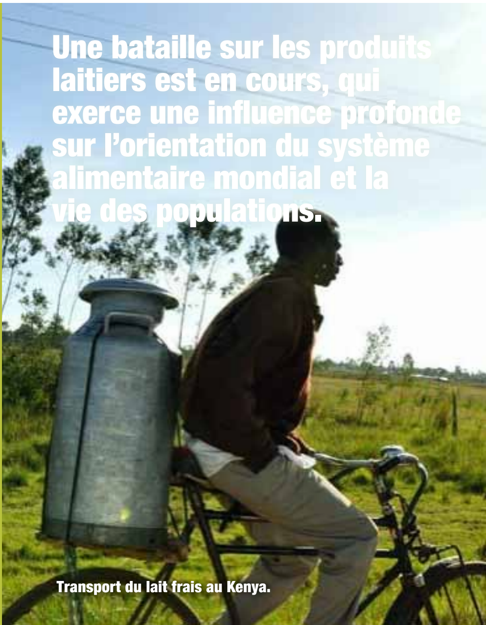
Transport du lait frais au Kenya.

Une bataille sur les produits laitiers est en cours, qui exerce une influence profonde sur l'orientation du système alimentaire mondial et la vie des populations.