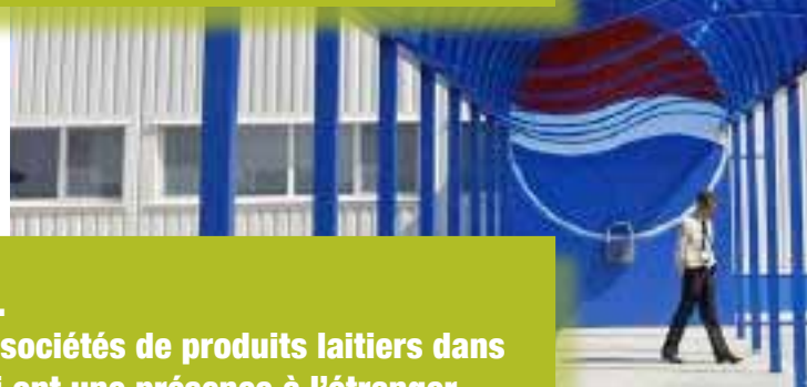
Tableau 5. Quelques sociétés de produits laitiers dans le Sud qui ont une présence à l'étranger

en dessous à droite: Usine Pepsi en Roumanie.