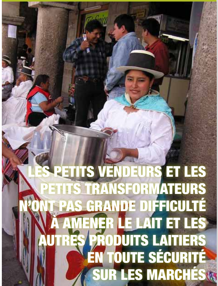
Au dessous: Une femme vend de la glace artisanale au Pérou.

LES PETITS VENDEURS ET LES PETITS TRANSFORMATEURS N'ONT PAS GRANDE DIFFICULTÉ À AMENER LE LAIT ET LES AUTRES PRODUITS LAITIERS EN TOUTE SÉCURITÉ SUR LES MARCHÉS