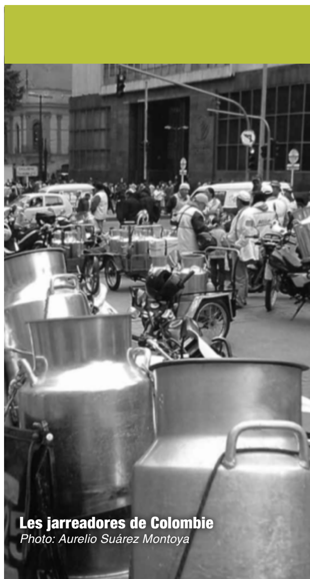
Les jarreadores de Colombie