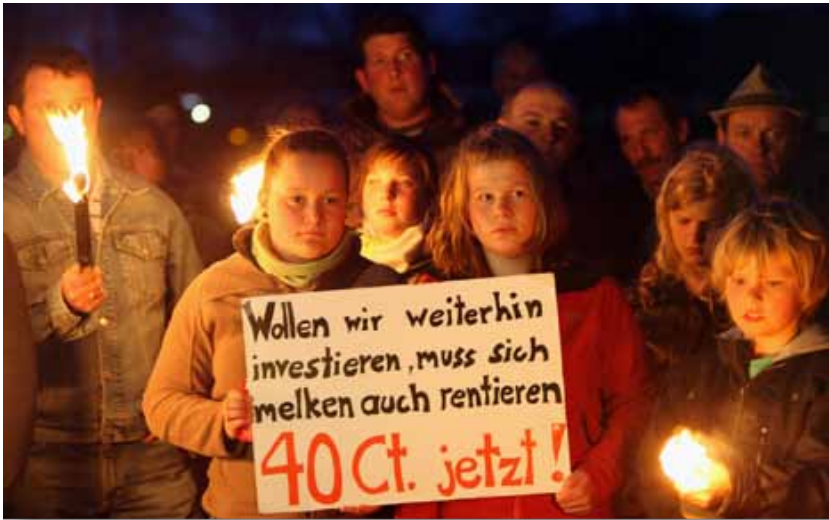
Des producteurs laitiers manifestent pour obtenir un prix du lait plus élevé, près de la crèmerie de Weihenstephan, le 16 avril 2009, à Freising, en Allemagne. Les agriculteurs demandent des prix à un niveau qui leur permet de continuer à produire du lait.