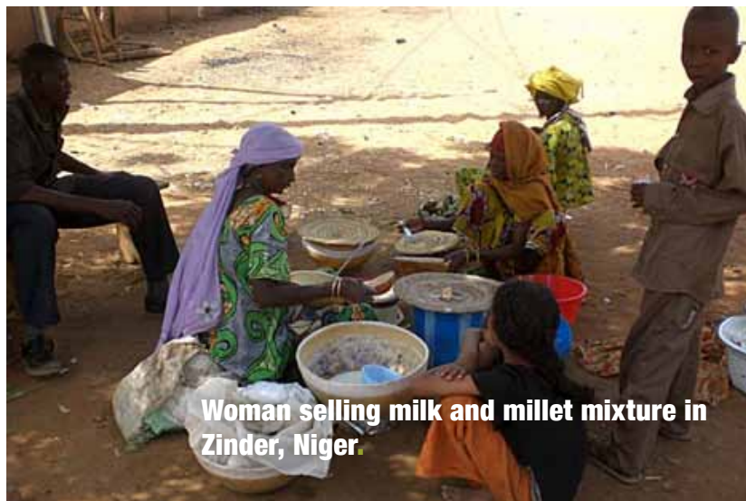
Woman selling milk and millet mixture in Zinder, Niger.