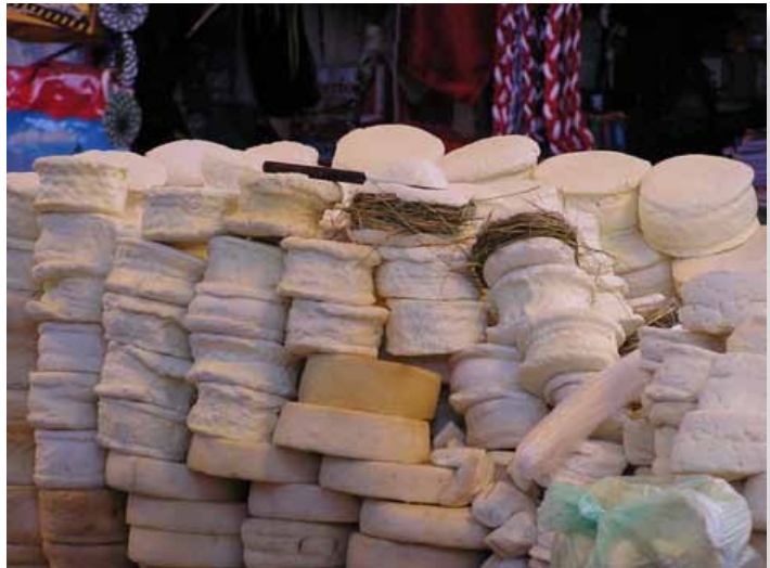
Au dessus: Fromages à un marché d'Ayacucho, au Pérou