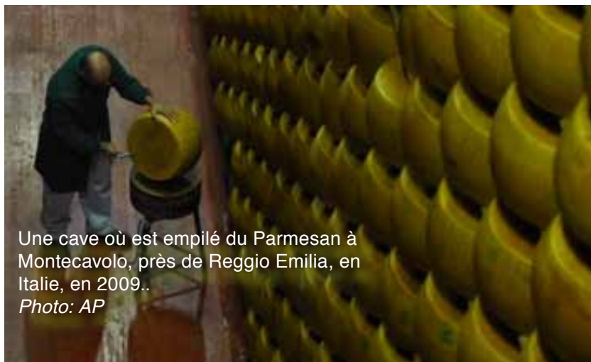
Une cave où est empilé du Parmesan à Montecavolo, près de Reggio Emilia, en Italie, en 2009..