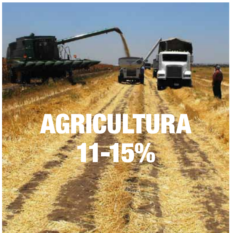
La agricultura empinadas colinas y montañas deforestadas en las Filipinas. En la parte inferior: el uso industrial de maquinaria pesada en la agricultura es responsable de las emisiones de gases de efecto invernadero más.