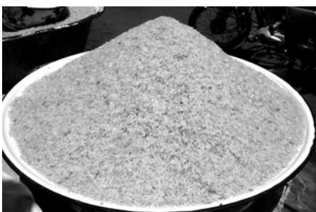
Riz local, Bénin

Les variétés de riz Nerica, obtenues par hybridation entre des riz africain et asiatique, sont actuellement qualifiées de « plantes miracles » susceptibles d'apporter à l'Afrique une révolution verte du riz annoncée depuis bien longtemps. Une puissante coalition de gouvernements, d'instituts de recherche, de semenciers privés et de bailleurs de fonds ont engagé une grande initiative pour diffuser les semences de Nerica dans l'ensemble des rizières du continent. Tous affirment que le Nerica peut développer les rendements et assurer l'autosuffisance de l'Afrique en matière de production rizicole. Cependant, hors des murs des laboratoires, le Nerica ne s'avère pas à la hauteur de la publicité tapageuse qui en est faite. Depuis que les premières variétés de Nerica ont été introduites en 1996, les expériences ont été mitigées chez les agriculteurs, qui signalent un certain nombre de problèmes. Le plus grave problème lié au Nerica est peut-être que sa promotion s'intègre dans un mouvement plus large d'expansion de l'agrobusiness en Afrique, qui menace de faire disparaître les fondements même de la souveraineté alimentaire de l'Afrique: les petits producteurs et leurs systèmes locaux d'utilisation durable de semences.