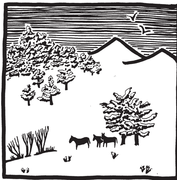
Ilustración: Rini Templeton

El informe indica también que los ganados nómadas de África occidental, Etiopía y Kenya producen carne de mejor calidad y generan más dinero en efectivo por hectárea que los “modernos” ranchos australianos o estadounidenses donde los animales permanecen en un solo sitio.