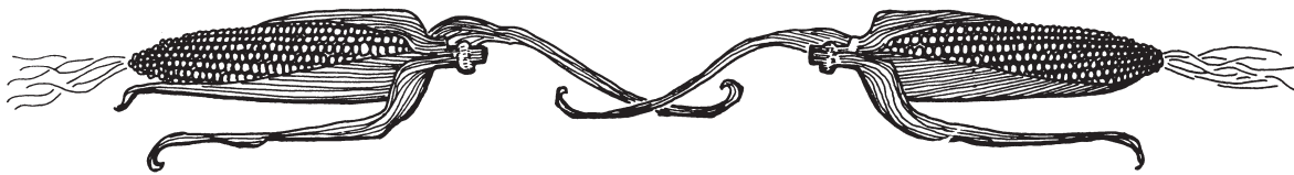
Ilustración: Rini Templeton