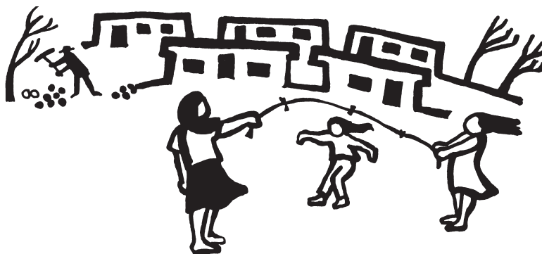
Ilustración: Rini Templeton

accionado con celeridad y eficiencia en lugar de ocultar su estulticia con la violencia del fusil. Aquí no se necesita represión, sino compasión; no se requieren balas, sino que comida. Y respuestas, no sólo de las autoridades, sino que también de los empresarios que se han hecho millonarios en el Chile neoliberal y cuyos edificios,