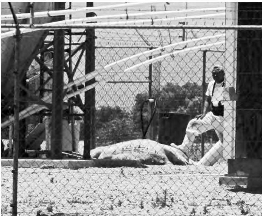
Los empleados de Granjas Carroll desechan los cadáveres rumbo a fosas comunes llamadas biodigestores. En la página anterior mostramos un detalle de otra de sus fotos

equitativo de campesinos y campesinas a la tierra. Se prohíbe el latifundio y la concentración de la tierra, así como el acaparamiento o privatización del agua y sus fuentes. El Estado regulará el uso y manejo del agua de riego para la producción de alimentos, bajo los principios de equidad, eficiencia y sostenibilidad ambiental”.