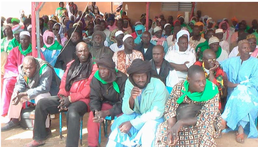
Los campesinos y los pastores nómadas del Kolongo Forum en la región de Mali conocida como Office du Niger hacen un llamado para que se suspendan los negocios agrícolas con inversionistas extranjeros.