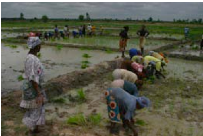
Los productores de arroz en el valle del río Senegal

El valle del río Senegal es la principal área de producción de arroz con riego en Senegal. Cerca de 120 mil hectáreas de dicha área son apropiadas para la producción de arroz de regadío y cerca de la mitad de tales tierras se cultivan hoy con irrigación. Estas tierras, la mayoría cultivadas por familias que tienen acceso a menos de una hectáreas, producen 70 por ciento de la cosecha nacional de arroz y le proporcionan modos de subsistencia a