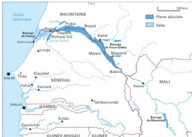
Carte 1. Sénégale

Demostrar que “ambas partes ganan” en este caso es muy difícil, pero la propuesta intenta demostrarlo. Alega que, de algún modo, el proyecto contribuirá a la autosuficiencia arrocerá de Senegal que brindará empleos a los campesinos que ya no pueden cultivar las tierras. “La fuerza productiva de trabajo será exclusivamente local con el fin de mejorar las condiciones de vida y por tanto proporcionará opciones económicas y sociales de desarrollo”, dice la propuesta. En cuanto a los numerosos pastores del área que perderán acceso a la tierra y al agua para sus rebaños, la compañía afirma que el proyecto pretende construir en el área. De este modo, alardea la compañía, los animales serán alimentados “con mayor facilidad y a menor costo”.