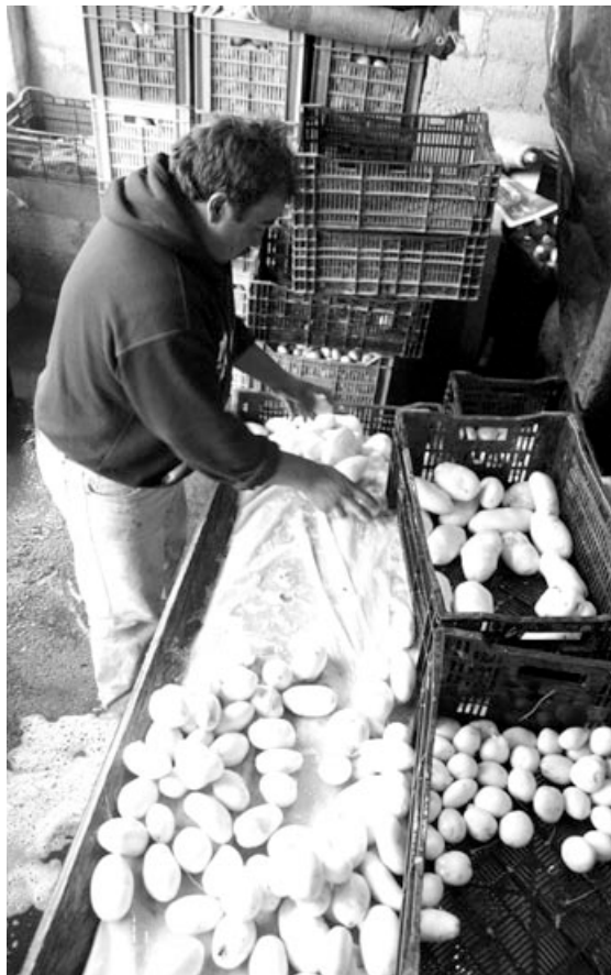
Cadena de lavado de papa.

Un ejemplo es el precio actual del arroz tailandés, un referente mundial. Su precio actual es de 614 dólares por tonelada, pero cuesta más del doble del promedio de los últimos diez años (290 dólares por tonelada). Los precios domésticos de los alimentos en muchos países en desarrollo, sobre todo en África subsahariana, no cayeron ni un poco y, en algunos casos, están de nuevo en aumento debido al impacto de la mala cosecha y la falta de crédito para importaciones. Sheeran apunta: “Los precios locales están subiendo. El pre-