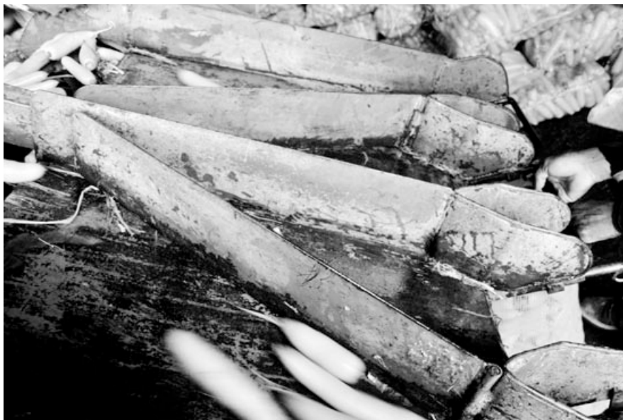
Cadena de lavado de zanahoria.

cos ni para adaptar los cultivos a la nueva situación, habrá una migración de cultivos a nuevas regiones en búsqueda de mejores condiciones climáticas. Áreas que hoy son las mayores productoras de granos pueden dejar de ser aptas para el cultivo mucho antes del fin del siglo. Una de las consecuencias más graves, afirma Pinto, es que la yuca puede desaparecer de la región semiárida. Aunque el cultivo se beneficie