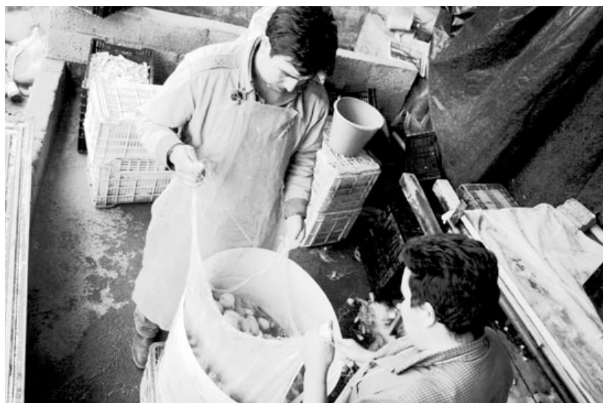
Lavando papas.