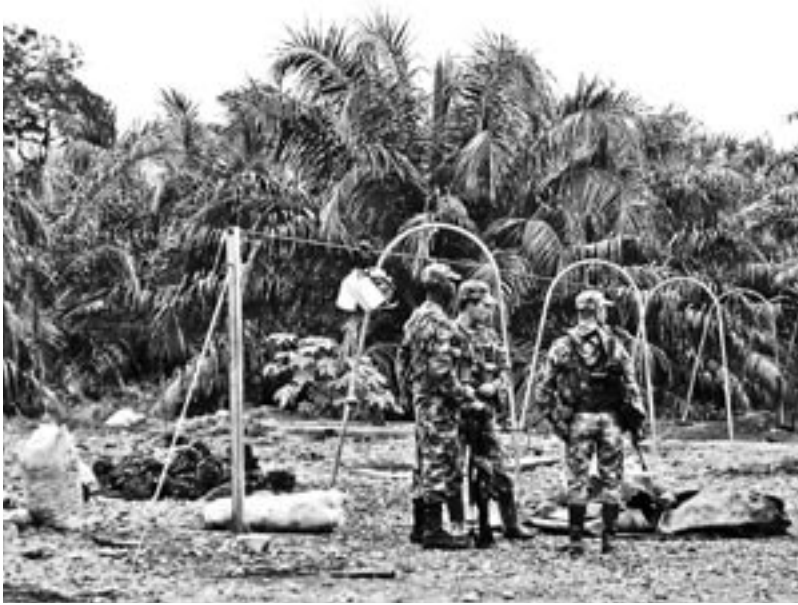
Militares vigilando la producción de palma aceitera en Colombia

Desde fines de los noventa, una nueva oleada de violencia paramilitar, aunque esta vez disfrazada de alternativa económica sustentable, ha dejado un saldo de casi 4 millones de desplazados forzados en el país. El propio ministro de agricultura del gobierno nacional colombiano ha dicho que los indígenas “tienen demasiada tierra”: 30 millones de hectáreas para un millón de personas. Insiste que habría que poner esos territorios en su justa dimensión (es decir, reducirlo a una hectárea por persona). Pero lo que no dice el ministro es que de ese territorio sólo es cultivable el 0.1%. El resto son montañas, bosques y fuentes de agua, ni más ni menos.