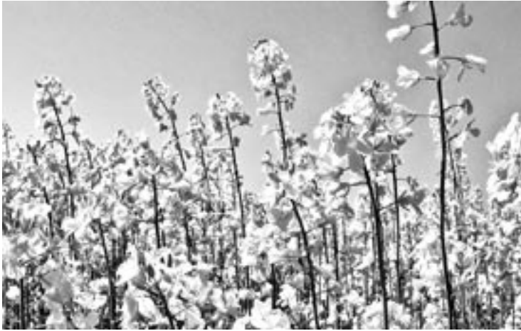
Cultivos de soja

unas 350 mil personas trabajando en la industria del biodiésel.