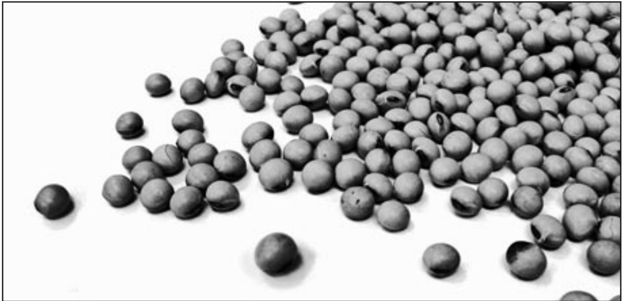
Semillas de soja

La presión sobre la tierra se intensificará a consecuencia de la fiebre actual por el biodiésel. La mayoría de los expertos de mercado augura una explosión de la demanda mundial en los próximos años. 11 Ello debido en parte a que Europa, que constituye actualmente el mayor mercado para el biodiésel en el mundo, se ha fijado metas ambiciosas de consumo de biodiésel. Su meta de incorporarle al diésel de petróleo un 20% de biodiésel para el 2020, requerirá 76 mil millones de litros de biodiésel al año. Eso es más que 20 veces el consumo actual de biodiésel en Europa. Como no cuenta con más suelos donde sembrar su propia materia prima (la colza) para biodiésel, Europa tendrá que incrementar enormemente sus importaciones tanto de aceite de palma como de aceite de soja. 12