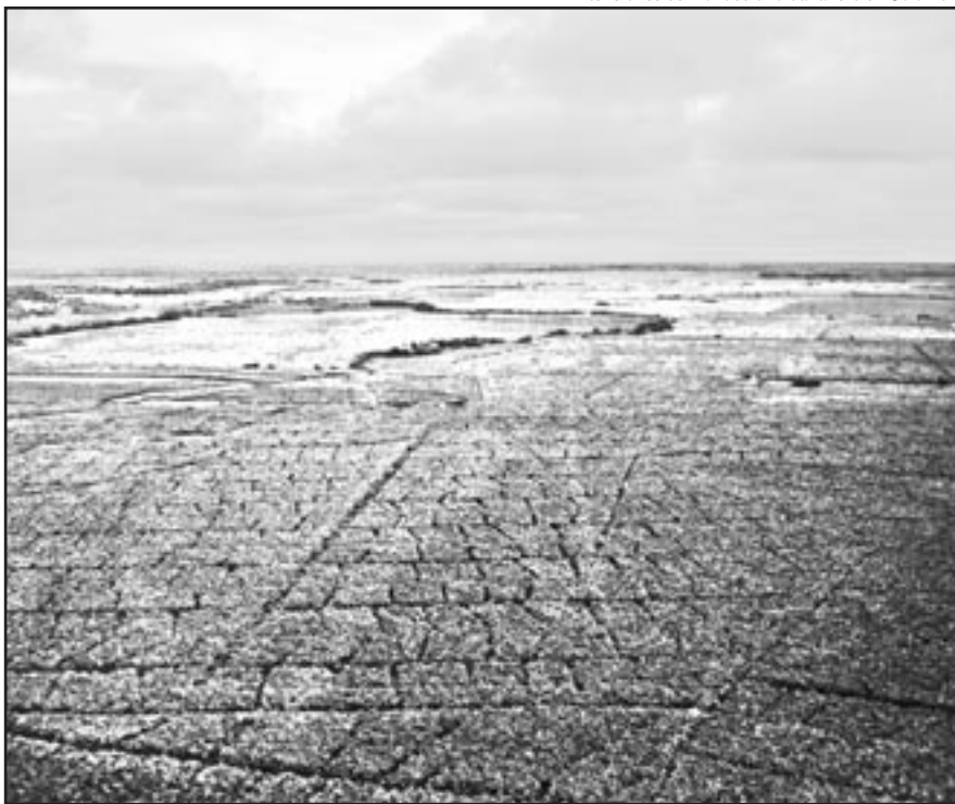
Extensiones de monocultivo bananero en Colombia

El biodiésel de aceite de soja es el capítulo más reciente de la conquista de Sudamérica a manos de la soja, un cultivo que consagra una nueva forma de explotación agrícola en la que predominan gigantescas empresas agroindustriales. La soja se ha propagado como reguero de pólvora en vastas zonas de Sudamérica en los últimos cuarenta