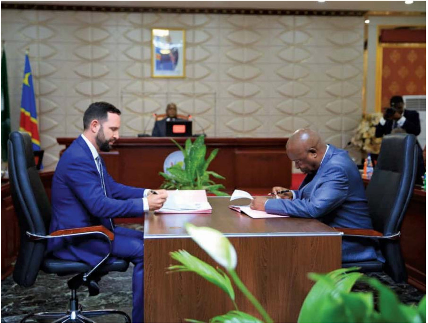
El ministro de Agricultura de la RDC y un representante de Vital Capital firmando en 2019 un memorando de entendimiento para poner en marcha cinco zonas agroindustriales en todo el país, con un coste de 150 millones de dólares.

El gobierno anfitrión del proyecto, por su parte, a menudo asegura capacidad de pago a partir de la venta de recursos naturales, como el petróleo o el gas natural. Además, como puede verse en el caso de Angola, pone a disposición las tierras para realizar el proyecto, incluso aunque provoque el desplazamiento de las comunidades locales. Una vez que el proyecto es aprobado, se contratan empresas y consultores israelíes, a precios exorbitantes, para asegurar la administración, los diseños, los equipos y los insumos.