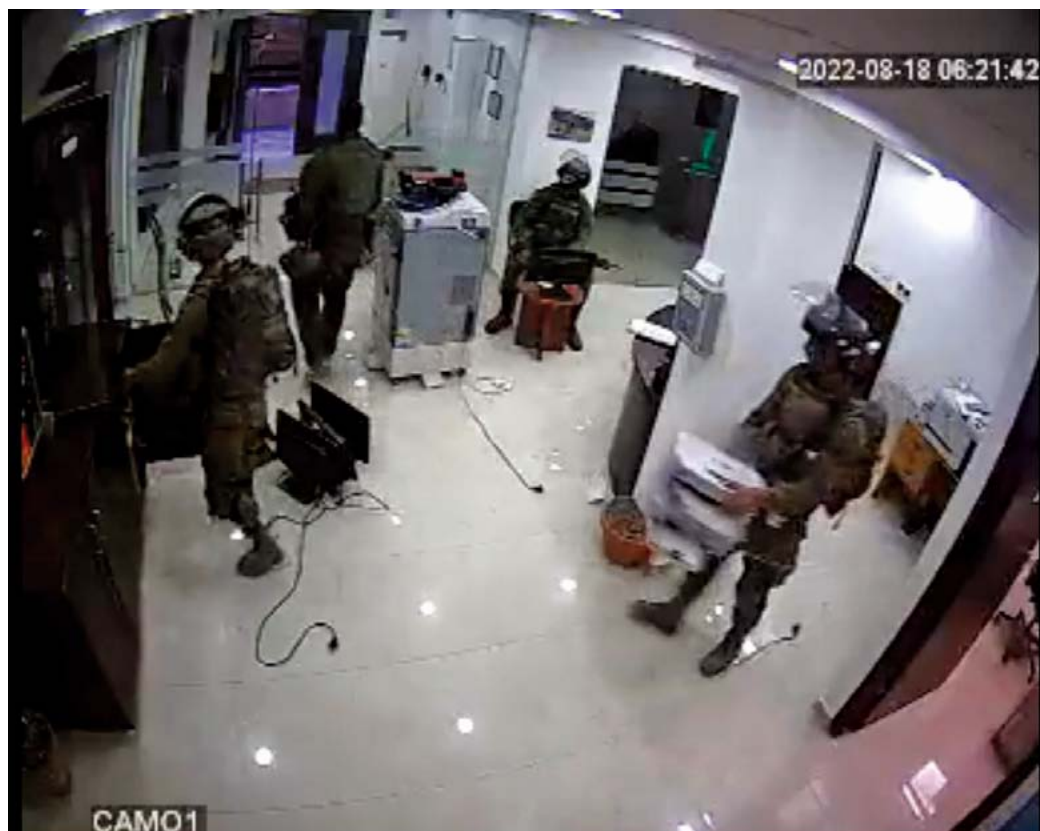
Allanamiento de las oficinas de UAWC por fuerzas israelíes, 18 de agosto.

Bsharat ha documentado, a través de su trabajo con la UAWC, el modo en que la ocupación israelí y su sistema de apartheid obliga a