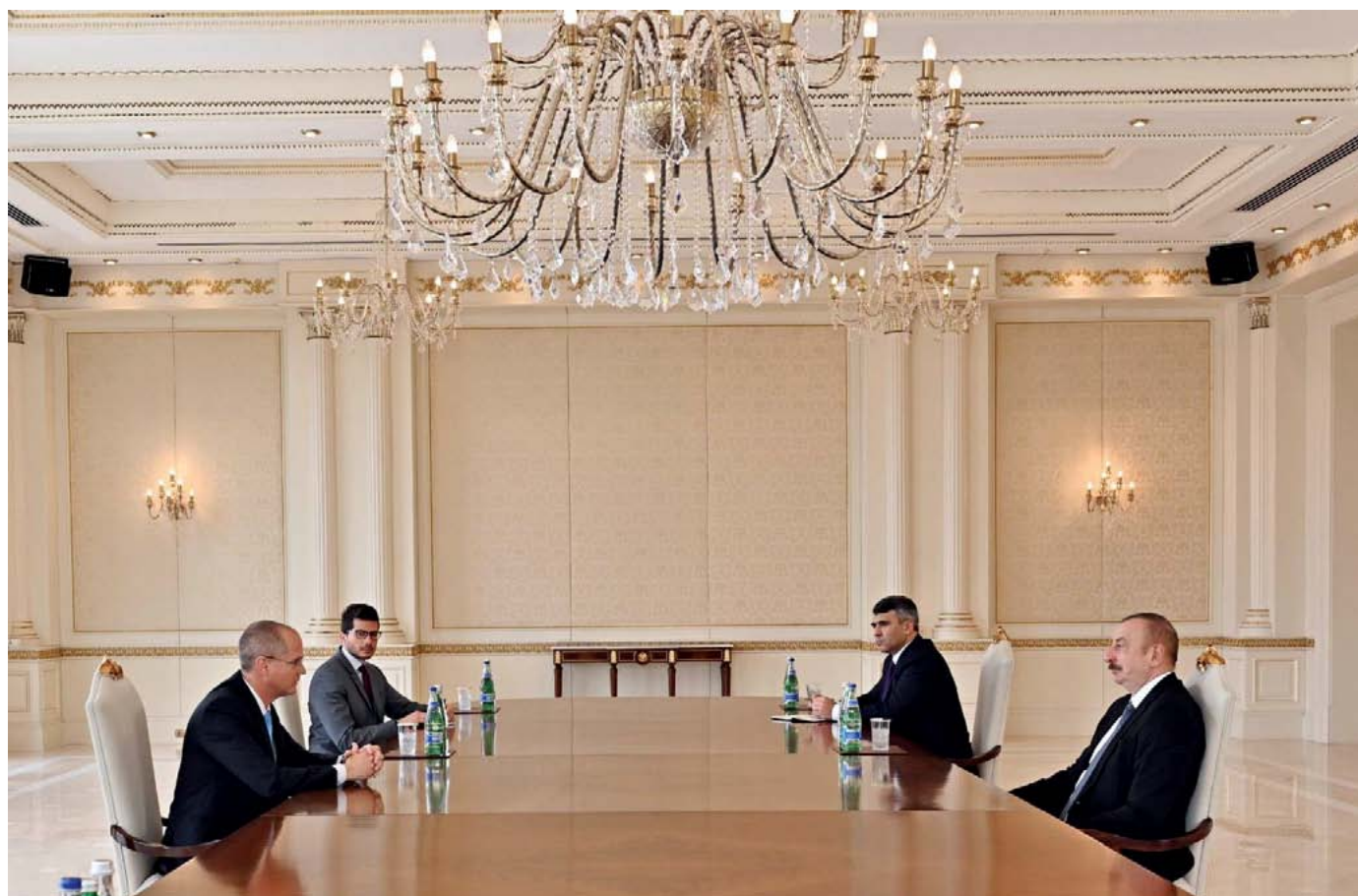
Reunión del presidente de Azerbaiyán, Ilham Aliyev, el 1 de mayo de 2022, con el ministro israelí de Agricultura y Desarrollo Rural, Oded Forer.

Tanto TerraVerde como Green 2000 poseen un historial de operaciones en países que son importantes compradores de armas de Israel. Comenzaron en