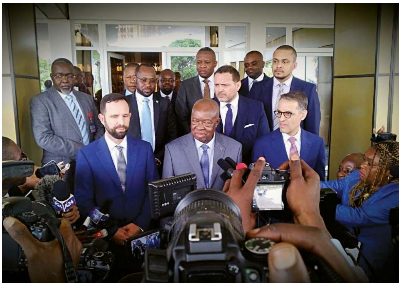
El ministro de Agricultura de la República Democrática del Congo, Jean Joseph Kasonga, con una delegación de Vital Capital Investments, el 7 de diciembre de 2019.