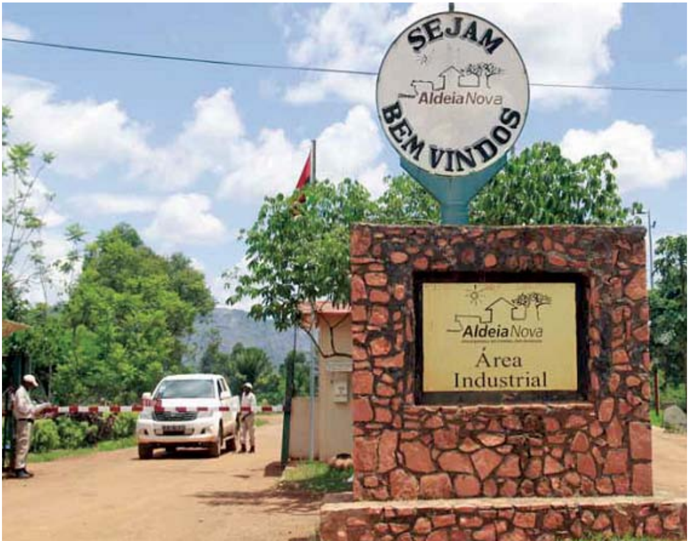
El proyecto Aldeia Nova de LR Group/Mitrelli Group en Angola.

de algún país rico en recursos naturales. La compañía israelí propone ambiciosos y multimillonarios proyectos agrícolas, contruidos y equipados con las últimas tecnologías israelíes y, por una buena tajada, ofrecen manejar todo, desde la obtención de los préstamos para construir las fincas hasta administrar los proyectos, por lo menos durante los primeros años.