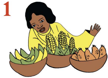
1 Senekelaw ka sumansiw be Farafinna balo.