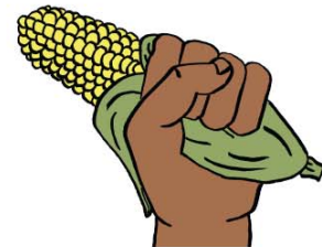
4 Farafinna kono, musow de ye sumansi kolosilikebagaw ye. 5 Sumansiko taabolo jɛnabolen senekelaw fe, o b'u ka senekeyoro n'a lamini soro jiidi doonin doonin wa o be senyerekorɔ fana sabati baloko siratige la.