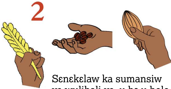
2 Senekelaw ka sumansiw ye wulibali ye, u be u bolo korɔ wa u soro ka di.