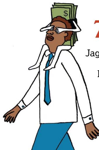
7 Jagokocakedaba minnu bolofara be jamana caman kono be ka Farafinna goferenamanw lasu walasa u ka son ka laadala sumansiko taabolo lagosi.

Lisez le rapport "Les vrais producteurs de semences" : https://www.grain.org/e/6045 https://afsafrika.org