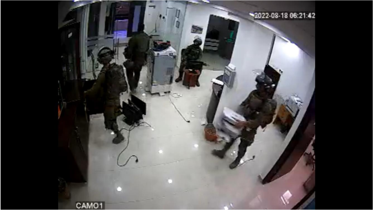
هجوم القوات الإسرائيلية على مكاتب اتحاد لجان العمل الزراعي، 18 آب أغسطس.

لذلك من الضروري مراقبة وكشف أنشطة الأعمال التجارية الزراعية الإسرائيلية في الخارج، ليس فقط لحماية مصالح شعوب تلك البلدان التي يعملون فيها ولكن أيضًا لبناء التضامن مع نضال الفلسطينيين ضد الفصل العنصري الإسرائيلي والاستعمار الاستيطاني والاحتلال. في كلتا الحالتين، تشكل الأعمال التجارية الزراعية الإسرائيلية تهديدًا للنضال من أجل السيادة الغذائية التي تقودها منظمات الفلاحين في فلسطين وحول العالم.