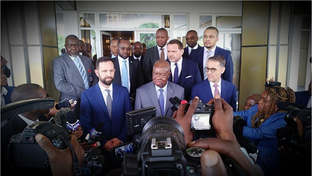
وزير الزراعة في جمهورية الكونغو الديمقراطية، جين جوزيف كاسونجا، مع الوفد المرافق له من فايتال كابيتال للاستثمارات، 7 كانون الأول ديسمبر 2019.

تتمتع إسرائيل بسمعة دولية في مجال الزراعة عالية التقنية. تقدم شركاتها كل شيء من أحدث أنظمة الري بالتنقيط إلى الطائرات بدون طيار لرش المبيدات. لكن الأعمال التجارية الزراعية الإسرائيلية تطورت من خلال احتلال عسكري وغير قانوني للأراضي الفلسطينية. وفي السنوات الأخيرة، ارتبط نموها ارتباطاً وثيقاً للترويج لأجندة إسرائيل الدبلوماسية والاقتصادية في الخارج. يُنفذ الكثير من دبلوماسيتها الزراعية من قبل حفنة من الشركات غير المعروفة التي يقودها ضباط سابقون في وزارة الدفاع والمخابرات الإسرائيلية ولديهم علاقات سياسية رفيعة المستوى. تتخصص الشركات التي يمتلكونها في مشاريع زراعية باهظة الثمن يتم تنظيمها من خلال وسائل مالية خارجية، بما في ذلك شراء المنتجات والتكنولوجيا الإسرائيلية، وفي كثير من الأحيان، يكون هناك ارتباط وثيق بصفقات الأسلحة. تعد إفريقيا هدفاً رئيسياً، لكن مشاريع الأعمال الزراعية الإسرائيلية