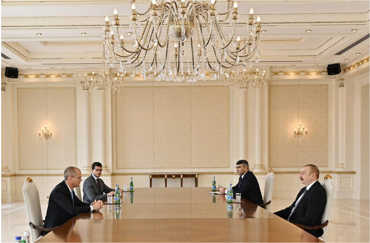
رئيس انريبيجان اهام عليلف خلال اجتماعه في الأول من أيار مايو 2022 مع وزير الزراعة والتنمية الريفية الإسرائيلي عويد فورير.

لأكثر من عقد من الزمان، كانت GRAIN تراقب أنشطة شركات الأعمال الزراعية الإسرائيلية في الخارج. لقد ازداد قلقنا بشأن الدور الذي تلعبه هذه الشركات في توسيع أعمال الزراعة التجارية، لا سيما في إفريقيا، وكيف تبدو أنشطتها المرتبطة بأجندات سياسية أخرى. على الرغم من تواجدها الدولي المتزايد والاهتمام الموجه لقطاع الزراعة الرقمية الإسرائيلي، إلا أن معظم هذه الشركات لا تزال غير معروفة نسبيًا، حتى في البلدان التي تعمل فيها. في هذا التقرير، نعمل على تعميق فهم هذه الشركات والتأثيرات التي قد تحدثها في الأماكن التي تنشط فيها.