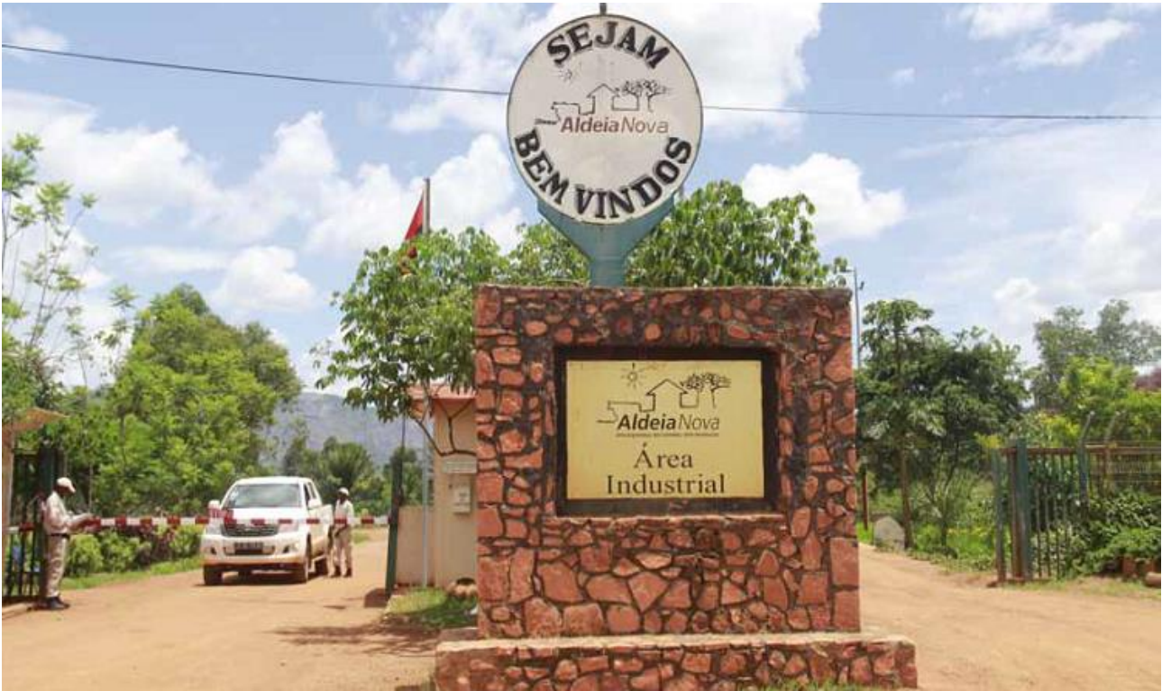
مجموعتي إل آر و متريللي، مشروع ألديا نوبا في أنغولا.

يقال إن العديد من المشاريع تستند إلى نموذج (الموشاف) أو نموذج "القرى الزراعية" الذي كان يستخدم في السابق لدمج المهاجرين إلى إسرائيل. 45 في دول الجنوب، هؤلاء عادة ما تكون المشاريع من (أعلى إلى أسفل)، أي من سدة الهدم إلى القاعدة، مع استبعاد المجتمعات المحلية من عملية صنع القرار، وتعتمد على استيراد التقنيات الإسرائيلية، مثل الدفيئات الزراعية وأنظمة الري والبذور المهجنة. كما يمكن رؤيته في أنغولا، فالقرويون المشاركون أشبه بالعمالة الرخيصة للشركة. حيث أنهم يدفعون للشركة مقابل استخدام المنازل والبنية التحتية وقطع الأرض الصغيرة والمدخلات التي يتم توفيرها لهم. كمحصلة يذهب كل شيء ينتجه القرويون إلى الشركة، وفي المقابل يحصل القرويون على القليل جداً، حيث يتعين عليهم سداد ديونهم (انظر حالة Aldeia Nova في الملحق الأول).