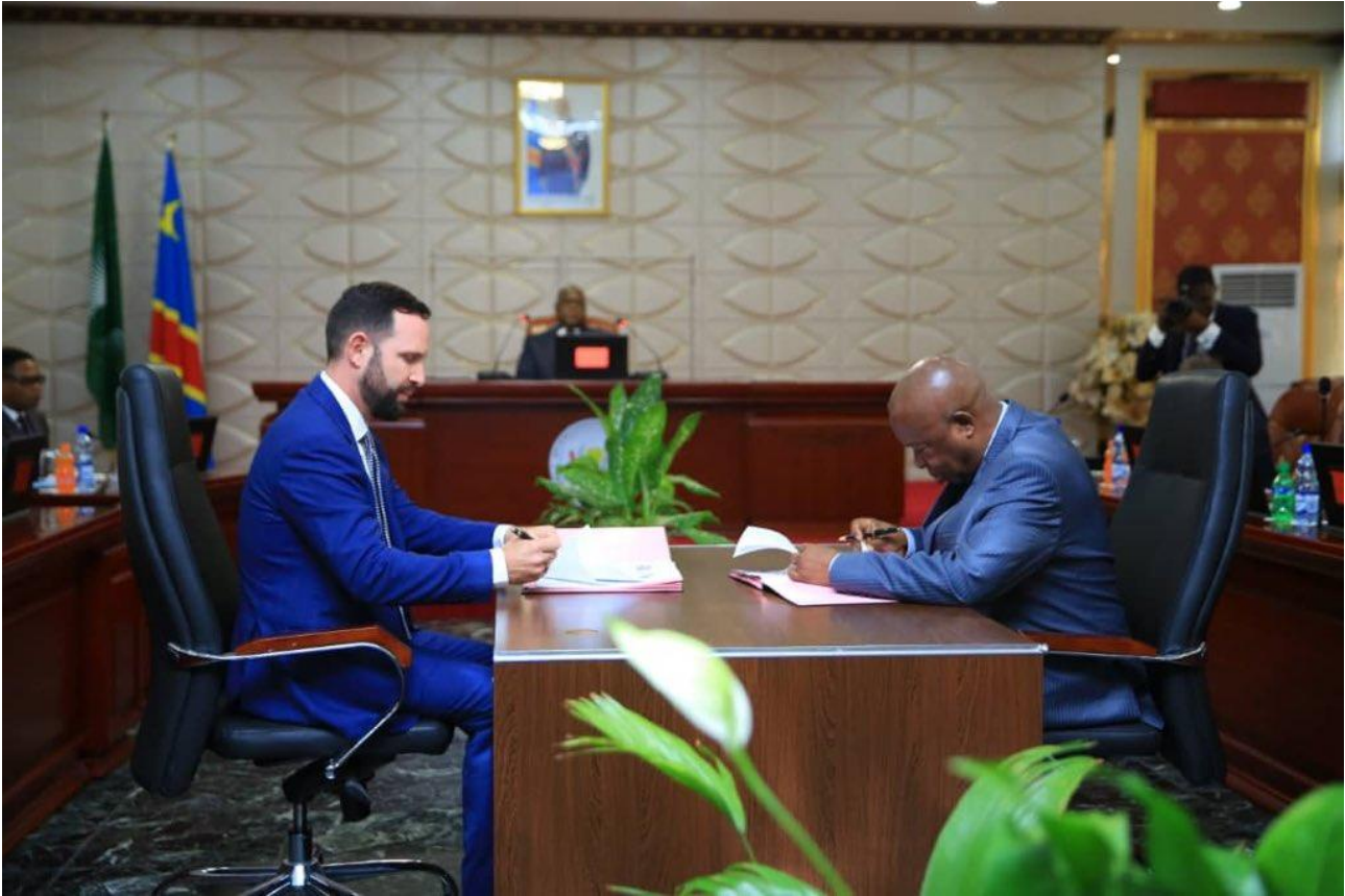
وزير الزراعة في جمهورية الكونغو الديمقراطية وممثل عن فايتال كابيتال يوقعون مذكرة تفاهم في العام 2019 لإطلاق خمسة مناطق زراعية صناعية في الدولة، بموازنة قدرت ب 150 مليون دولار.

توصل الجانبان إلى أول اتفاق في عام 2016 لتزويد شركة تابعة لمجموعة LR بمساحة 2000 هكتار لمزرعة الكاكاو في فيدرا، والتي لم تتحقق بعد. 48 بعد ذلك، في عام 2018، أبرموا اتفاقية ثانية لمجمع سورينام الزراعي الصناعي، وهو مشروع ضخم سيشمل بناء 500 مزرعة أبقار لللبان ومصانع، ومزرعة دواجن كبيرة ومزرعة محاصيل بمساحة 600 هكتار في مناطق وانبيكا وساراماكا. 49 وفقاً للوثائق التي تم تسريبها للجمهور في أغسطس 2019، سيتم الدفع لمجموعة LR Group لتنفيذ الخطة، لكن جميع التكاليف ستتحملها حكومة سورينام، من خلال خط ائتمان بقيمة 67 مليون يورو من Credit Suisse ، بترتيب من مجموعة LR Group. 50